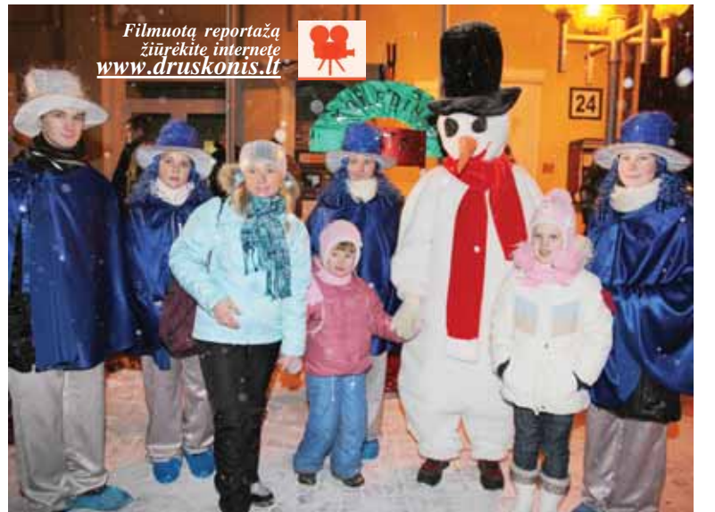
Filmuota reportažą žiūrėkite internete www.druskonis.lt