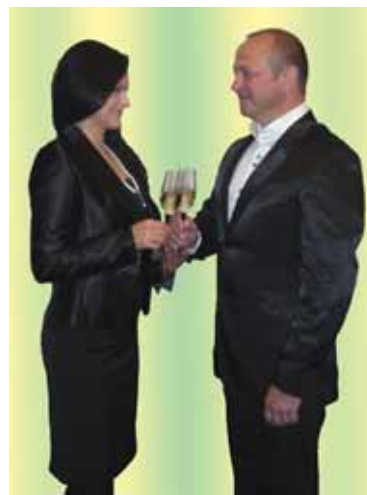
“Susituokėm be didelių iškilmių. Nenorėjau jokio viešumo”, - sako meras

- Bet Ineta juk jauna moteris, nejaugi savo vestuvėms ji nenorėjo puošnios suknelės ir būrio svečių?