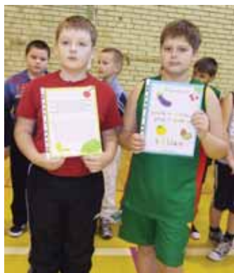
Vaikai mini projekte „Sveikas maistas pagal spalvas“

dinio ugdymo mokytojų metodinė grupė organizavo įvairius renginius, kurių tikslas - nuo mažens formuoti vaikų