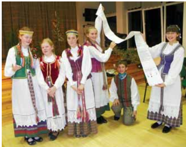
Naujokės (kairėje) su krikštatėviais

Kaip prieš kiekvieną egzaminą svarbiausia yra gerai paruošti namų darbus. Jau tradicija tapo inscenizuoti kokią nors dainą. Šįkart merginos pasirinko žaismingą vaikų dainą apie pelėdą. Negalėjome atsistebėti, kaip iš paprastų akcentų buvo sukurtas puikus spektakliukas. Jaunosios racilukės sugebėjo ir susukti lizdą, ir išperėti pelėdžiukus, ir juos nuprausti, aprengti, ir dar Vilniun bei Kauran suvažinėti... Tačiau namų darbai niekas nesibaigė – dar laukė užduotys. Pirmoji buvo, ko gero, pati sunkiausia: reikėjo iš atminties nupiešti „Racilukų“ ženklą, kuris yra kupinas įvairiausių vingrybių. Antroji užduotis skaidrėmis vertė prisiminti racilukių nuo-