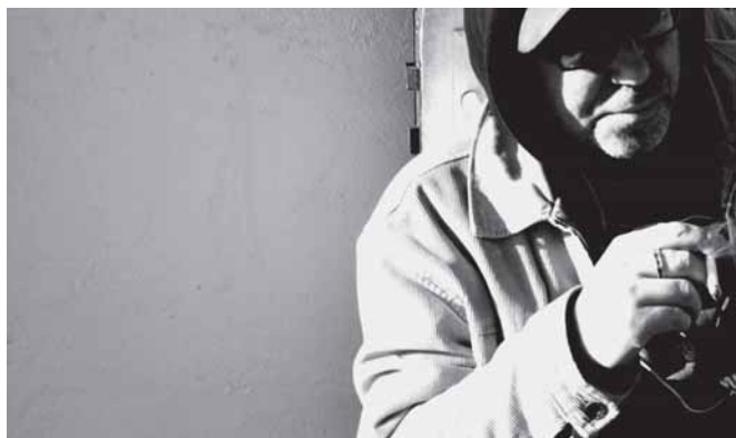
G.Šatūno meninė fotografija sulaukia dėmesio tiek Olandijoje, tiek Lietuvoje