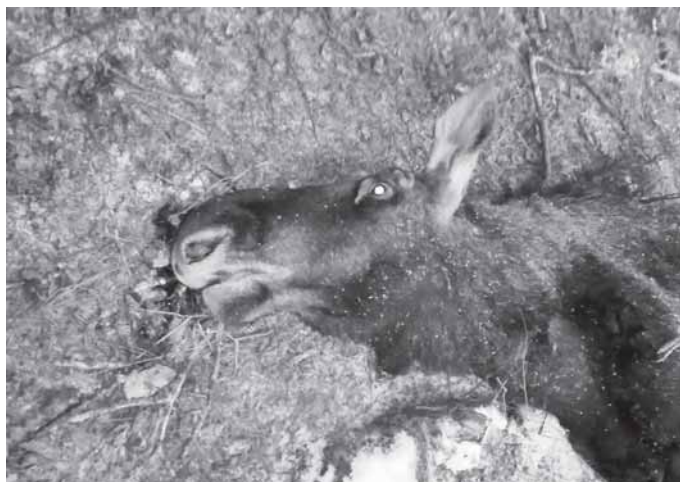
Briedis, pašautas lapkričio 28 dieną miške, šalia Guobinių kaimo