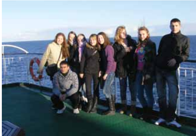
Kelto „Romantika“ denyje

Ankstų lapkričio 15 d. rytą gausus „Atgimimo“ vid. mokyklos 8-11 klasių mokinių būrys su 6-iais mokytojais nekantravo pradėti pažintinę 3 dienų kelionę po Latvijos pilsis, o svarbiausia – kruizo iš Rygos į Stokholmą. Latvijos pilys nenuvylė. Rundalės rūmuos, vasaros rezidencijoje, dėmesį traukė autentiškų drabužių, aksesuarų ekspozicijos. Rygos uoste daugelis pirmą kartą regėjo išpūdingo dydžio – 14 aukštų – keltą, talpinantį 2500 žmonių. Tai antras pagal dydį Baltijos jūroje plaukiojantis keltas. Prabangiame milžine laukė įvairios pramogos. Visą naktį kelte verda gyvenimas: skamba gyva muzika, veikia diskotekos, karaokė, parduotuvėlės. Čia galima pamatyti įvairiausio plauko žmonių, iš kurių mums labiausiai įsiminė indų kompanija ir „braliukų“ latvių grupė, su kuriais susibičiuliavome. Pramogos,