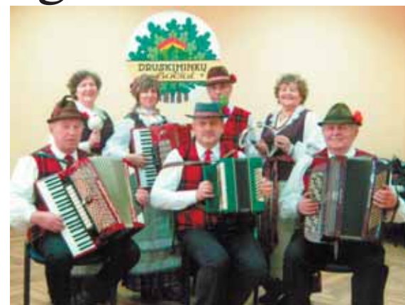
Druskininkų „Bočių“ kaimo kapela

prieš adventinę popietę, kurioje buvo linksma ir smagu. Pilnutėlėje salėje po šeimininkų alytiškių „Bočių“ bei Marcinkonių etnografinio ansamblio pasirodymų Druskininkų „Bočių“ sveikatinimo klubo narės pašoko 4-is linijinius ritminius šokius, gimtosios žemės dosnumą apdainavo moterų ansamblis, pagrojo mūsų kaimo kapela.