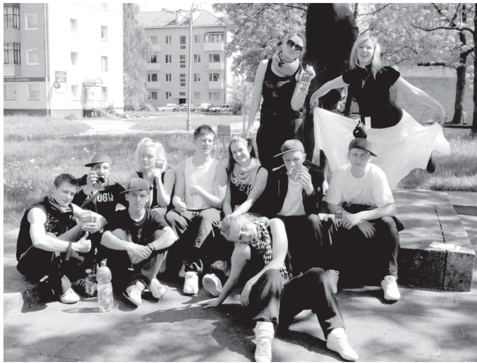
Druskininkų jaunimas skina pergales Lietuvos gatvės šokių čempionatuose

- Apie tai niekada negalvojome. Kiek žinau, pagal vieną versiją purvini šokiai - tai šokiai, kuriuos kubiečiai šokdavo nespėję nusiprausti po darbų cukranendrių plantacijose. Pagal kitą jie taip pavadinti dėl to, kad juose yra daug judesių klubais. Tačiau šiuolaikiniai choreografai sutartinai tvirtina, kad purvini šokiai - tai aistra, noras judėti, išreikšti savo jausmus šokyje. Iš tiesų šokis yra ne tik emocijų ar jausmų išreiškimas, tai hobbis, užsiėmimas, kai kuriems ir gyvenimo dalis. Mūsų su broliu patirtis liudija, jog pradėjęs šokti, dažnai negali sustoti. Kaip bepadavintume tą pomėgį – purvinu, švari ar aistringai, žinau tik viena – tegul tik jaunimas šoka, o ne „geria alų po medžiu“. Dėl to būsim laimingesni visi.