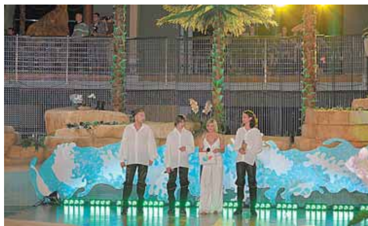
Druskininkų vandens parke - pramogos ne tik kūnui, bet ir sielai