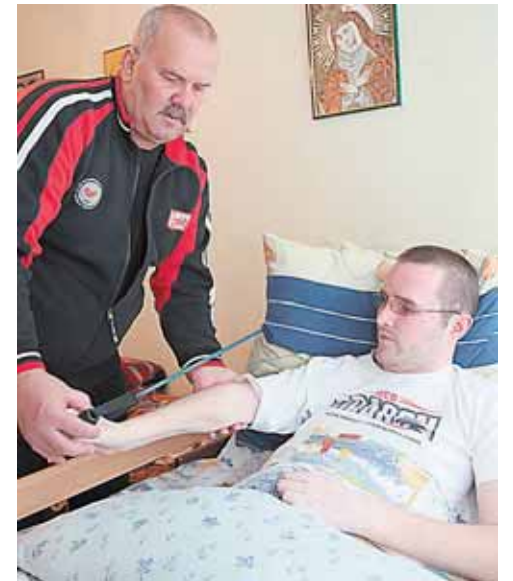
Tėtis kasdien padeda sūnui treniruotis