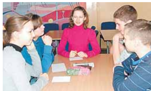
8a klasės komanda - viktorinos nugalėtoja

apie surinktus taškus, stiprėjo noras neatsilikti nuo varžovų ar juos pralenkti. O kur dar kūrybinių jėgų išbandymas - sukurti ketureilį, rimui pavartojant nurodytus žodžius! Ir krovė komandos savo kraitį. Komisijoms, kuriose buvo lietuvių kalbos mokytojos, suskaičiavus surinktus taškus, paaiškėjo nugalėtojai - 7d ir 8a klasių komandos. Reikia pa-