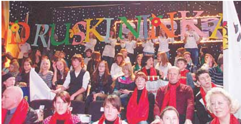
Dzūkijos sirgaliai iš Druskininkų