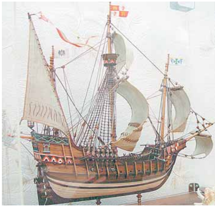
1. 1492 metų Kolumbo laivas "Santa Maria", atradęs Ameriką 2. XX amžiaus pradžios burlaivis "Pourgua pas", apiplaukęs pasaulį, bet paskendęs Šiaurės ledjūre 3. Atkurtas Petro I-ojo laivas "Dievo apvaizda" (1700 m.)