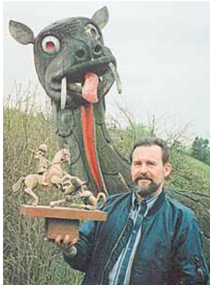
Filmuojant „Mūsų miestelius“ Aukštadvaryje