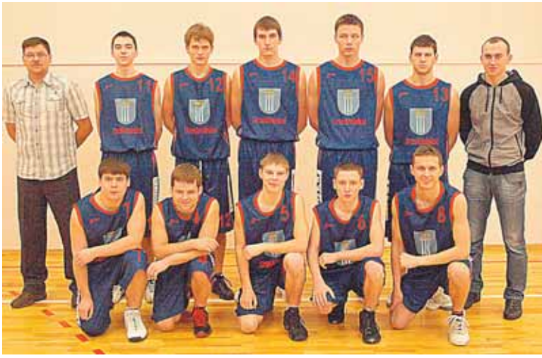
Druskininkų „Atgimimo“ vid. mokyklos klasės komanda, Alytaus apskrities bendrojo lavinimo mokyklų klasių krepšinio varžybų Druskininkų savivaldybės taurei laimėti 3-ame etape iškovojo 1 vietą

● Druskininkų sporto centre pasibaigė Alytaus apskrities bendrojo lavinimo mokyklų klasių krepšinio III etapo varžybos Druskininkų savivaldybės taurei laimėti. Be pralaimėjimų rungtyniavo tik Druskininkų „Atgimimo“ vid. mokyklos klasės komanda, kuri šiame etape iškovojo 1 vietą, 2-oje vietoje - Alytaus Adolfo Ramanausko-Vanago gimnazijos klasė, 3-oje - Varėnos „Ažuolo“ gimnazijos klasė, 4 - Simno gimnazijos klasė, 5 - Šeštokų vid. mokyklos klasė. Rezultatų suvestinė po III etapo varžybų: