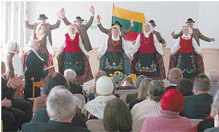
Druskininkų pagyvenusių žmonių kolektyvo „Suktinis“ šokiai ricieliškiams