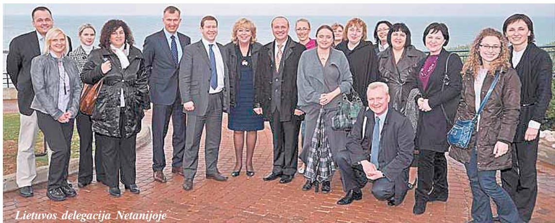
Lietuvos delegacija Netanijoje