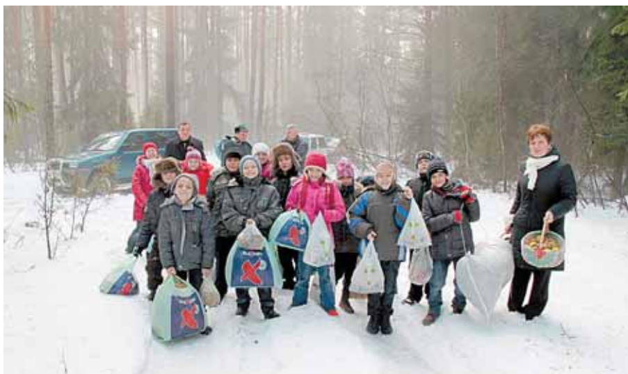
Trečiokai su vaišėmis žvėreliams

paukštelius. Taip pat visą savaitę miško gyventojams rinko maistą, kurį aplinkosaugininkų ir medžiotojų mašinomis nugabeno į mišką. Ten paruošė gausų vaisių stalą žvėreliams.