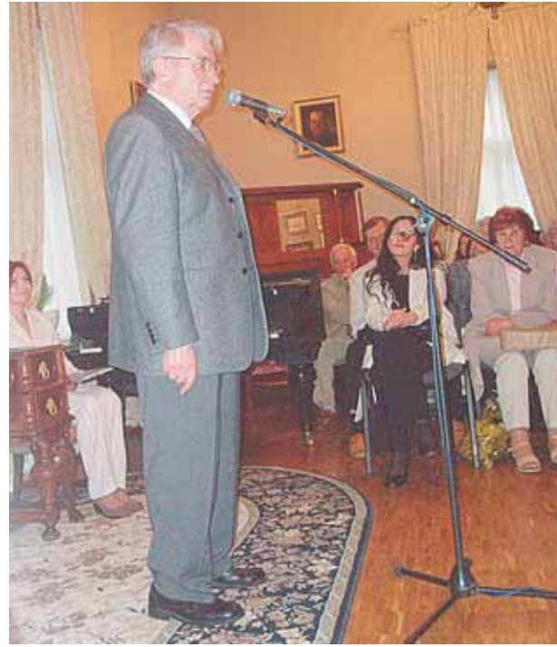
Šviesios atminties poetas susitikime su druskininkiečiais Miesto muziejuje 2006 m.