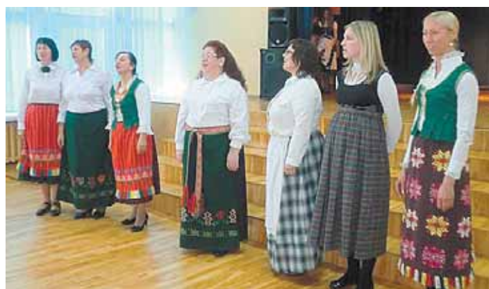
„Saulės“ pagrindinės mokyklos mokytojų ansamblis