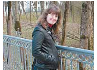
o Inga mėgsta dainuojamąją poeziją