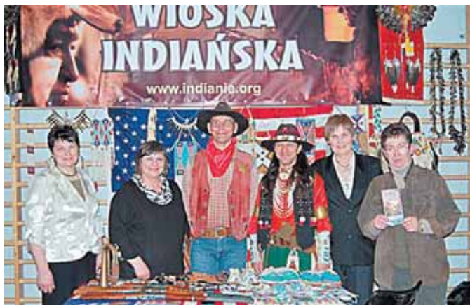
Druskininkų gidai Lenkijos turizmo mugėje