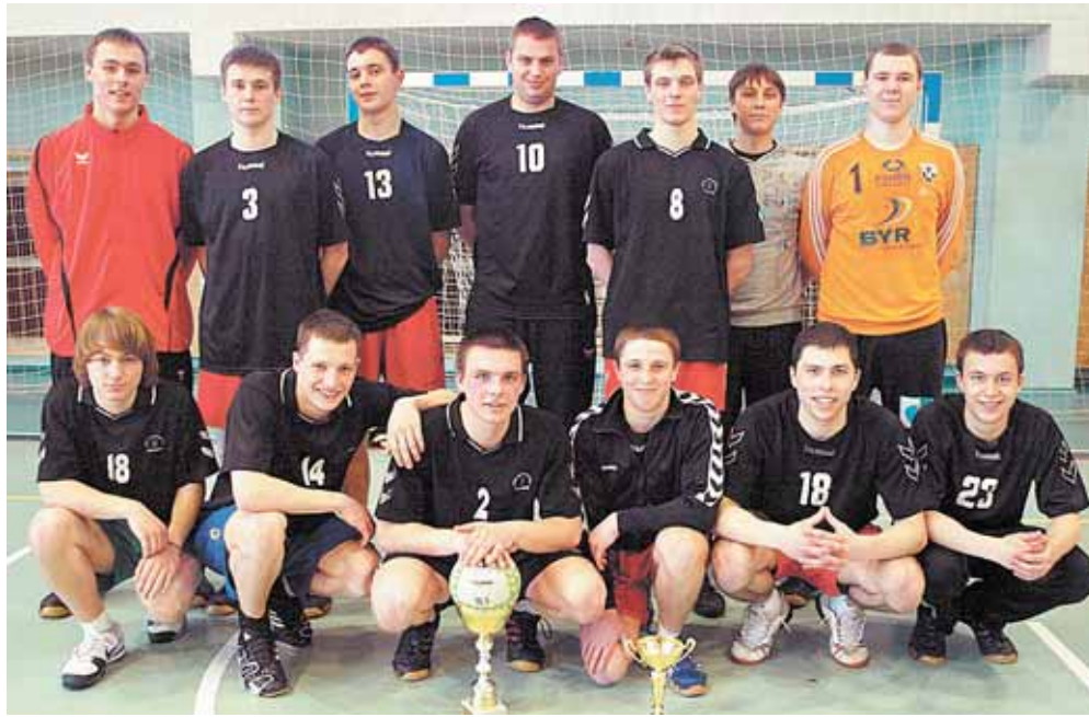
Druskininkų SC komanda - tarptautinio jaunojo šaulio Giedriaus Matulionio atminimo rankinio turnyro 2-os vietos laimėtoja

Turnyre komandos rungtyniavo suskirstytos į 2 pogrupius. Buvo žaidžiama vieno rato sistema. 1-ojo pogrupio varžybose Druskininkų SC komanda rezultatu 27:23 įveikė Elbingo komandą ir 29:19 Vilniaus SM „Taurą“, kuris po įtemptos kovos 25:24 įveikė svečius iš Lenkijos. Tad 1-ame pogrupyje 1-oji liko Druskininkų SC, 2-Vilniaus SM „Taurus“ ir 3 - Elbingo komandos. 2-ame pogrupyje Lietuvos jaunųjų rinktinė 20:9 įveikė Varėnos SM ir 27:3 Kauno SM „Gaja“ komandas, o varėniškiai 16:13 nugalėjo kauniečius. 2-ąją varžybų dieną įtemptas varžybas dėl 5-6 vietų laimėjo 22:21 Kauno SM „Gaja“, nugalėjusi Elbingo ekipą. Kovoje dėl 3-4 vietų Vilniaus SM „Taurus“ nugalėjo 27:26 Varėnos SM komandą. Finale Lietuvos jaunimo rinktinės ir Druskininkų SC komandos parodė aukšto lygio veržlį ir kovingą žaidimą. Tik rungtynių pabaigoje Lietuvos rinktinė rezultatu 33:30 įveikė Druskininkų SC komandą ir tapo 9-