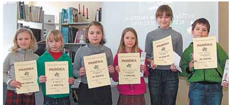
Raštingiausieji Druskininkų pradinukai