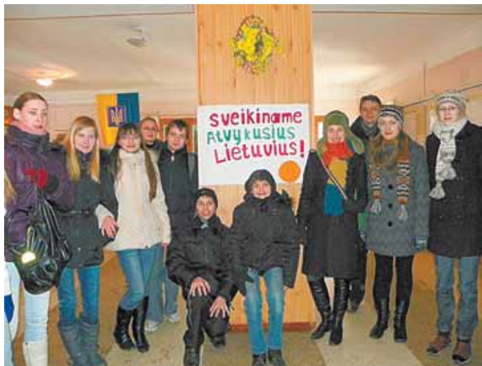
„Racilukų“ sutiktuvės Kijeve