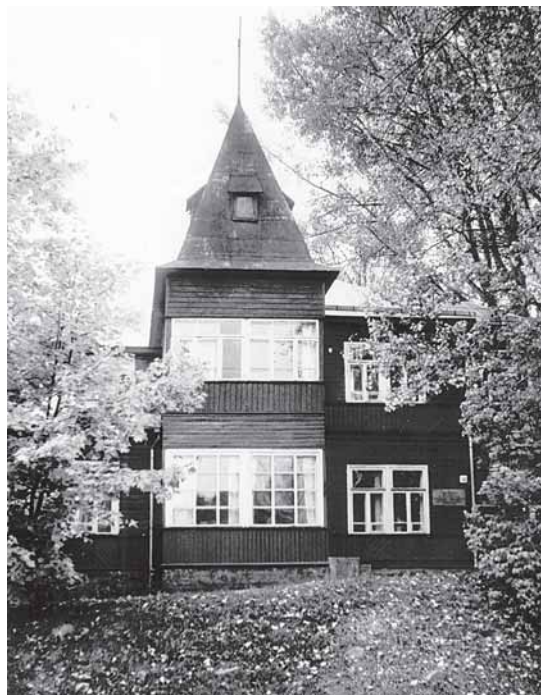
Pastatas M.K.Čiurlionio g. 50, kur 1961-1976 m. buvo Druskininkų muzikos mokykla