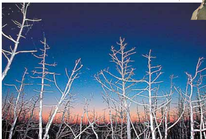
Nuotrauka laureatė "Miręs miškas", kurioje saulėlydžio metu meniškai nufotografuotas gaisro nuniokotas miškas Nidoje