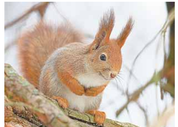
Nuotrauką "Voveraitė" galima išvysti šiuo metu viešbutyje "Pušynas" veikiančioje fotoparodoje

Nors mūsų miškai ne tik retų paukščių, bet ir žvėrių kadrams yra dėkingi, tačiau J.Bilinskas specializuojasi sparnuotuosius fotografuodamas ar filmuodamas, nes visą gyvūniją objektyvu aprėpti yra keblu. Kita vertus, gyvūnai labai jaučia kvapus, todėl sudėtinga tinkamo momento sulaukti. "Norint