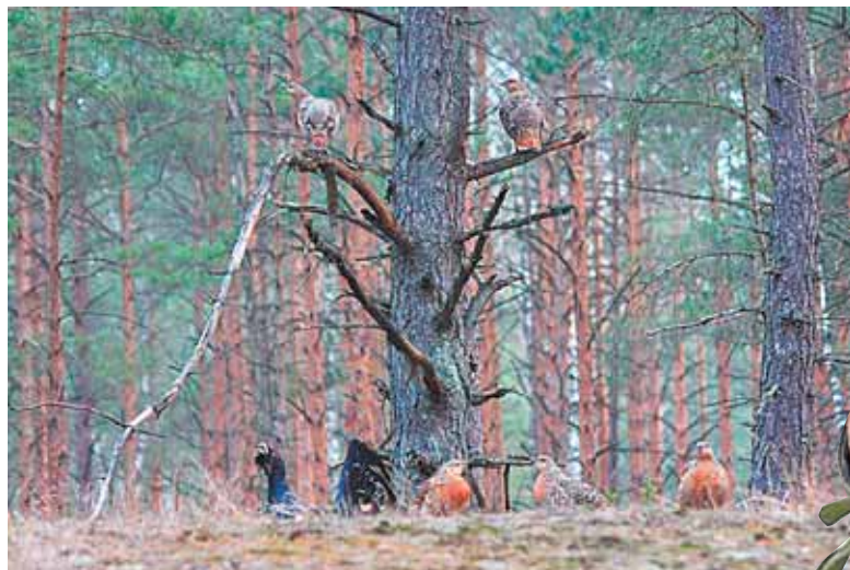
Unikali nuotrauka "Haremas", kurioje užfiksuotos kurtinių tuoktavių Druskininkų urėdijos miškuose

"Į fotografavimo palapinę reikia ateiti iki 18 val., nes vėliau į tuoktavietę pradeda rinktis kurtinių patinukai, - aiškina J.Bilinskas. - Palapinėje tyliai reikia laukti ryto. Teksėti patinukai pradeda dar tamsoj. Prašvitus į tuoktavietę pradeda rinktis patelės. Jos laikosi prie stipriausio patino, kuris "prižiūri harema". Jei patelė nori nueiti į ša-