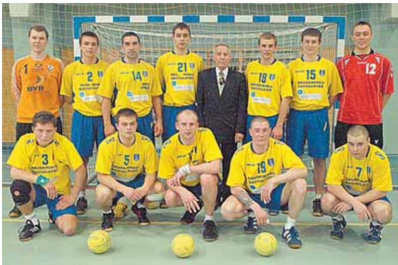
Druskininkų SC/RK komanda užsitikrino teisę varžytis Lietuvos rankinio pirmenybių stipriausiųjų komandų ketveriukėje