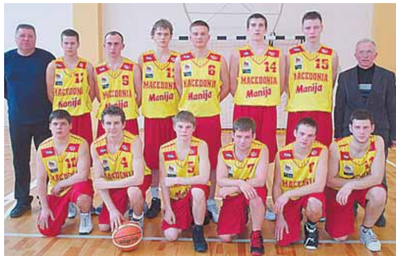
„Atgimimo“ vid. mokyklos komanda bendrojo lavinimo mokyklų vaikinių krepšinio čempionate „Manija“ simboliškai atstovauja Makedonijai