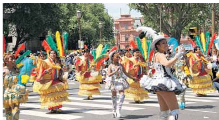
Bolivijos išeivių eiseną Buenos Airėse