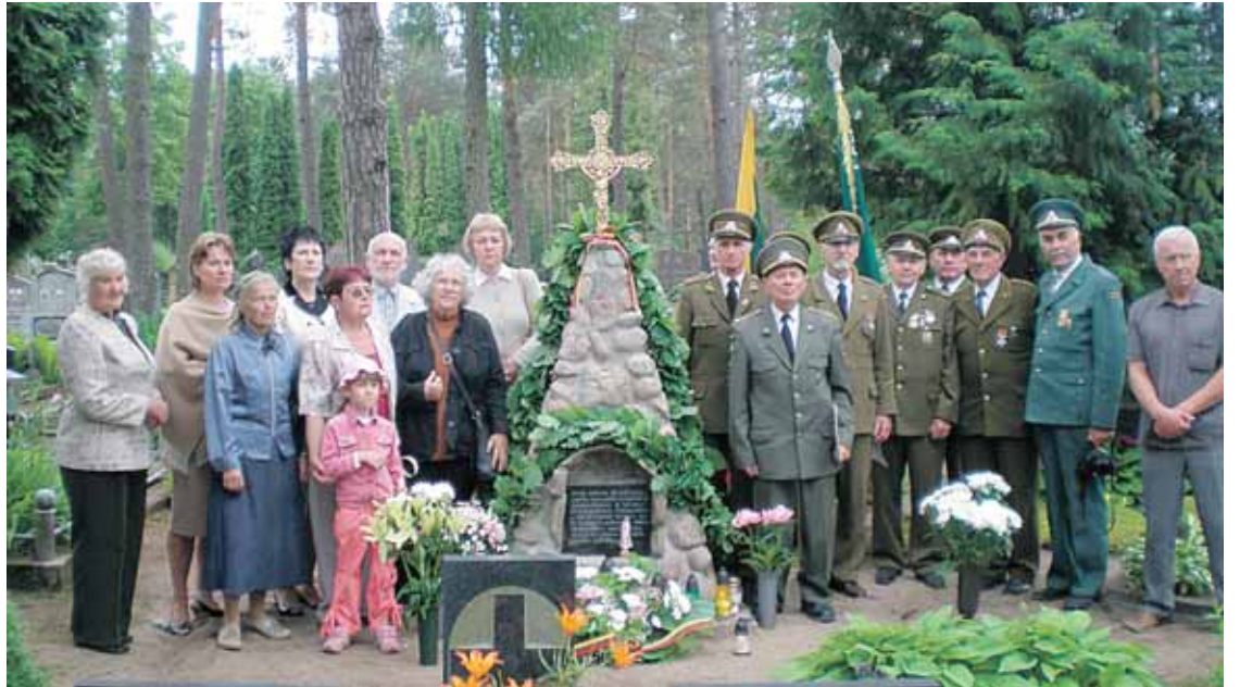
Prie paminklo žuvusiems 1923 m. Varviškės mūšyje Leipalingio kapinėse