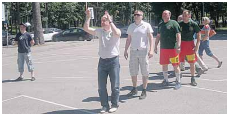
Mūsiškių rikiuotė baudų ir krepšį metimo konkurse