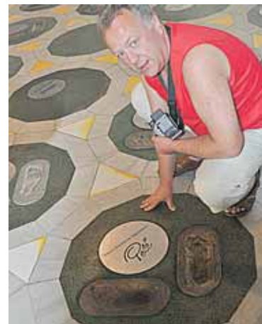
Brazilijos Maracanos stadione prie futbolininko Pele išpaustų pėdų