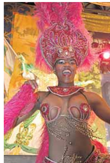
Braziliško šou Rio de Žaneiro klu- bo dalyvė