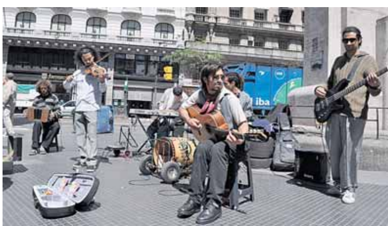
Buenos Airių gatvės muzikantai