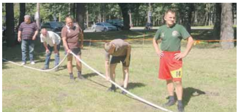
Virvės traukimo varžybose mūsiškiai užėmė 4 vietą