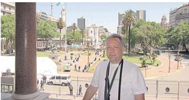
Argentinos prezidentūros balkone