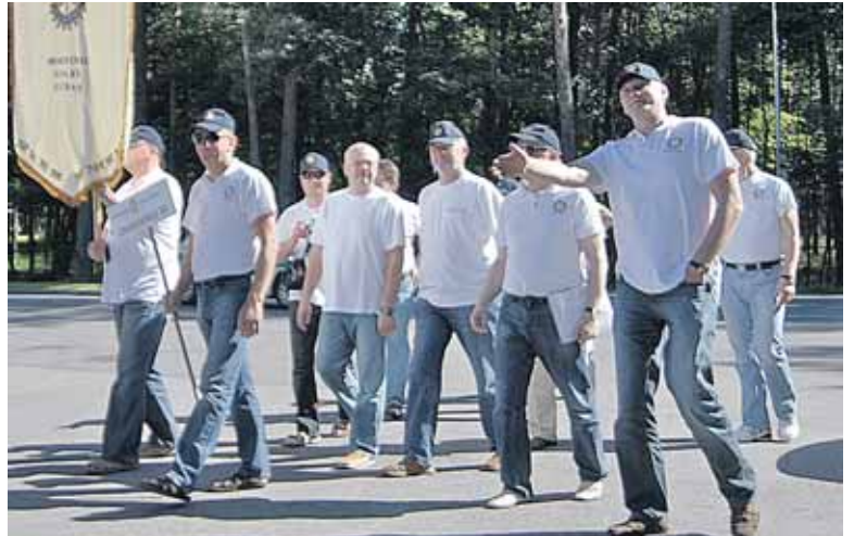
Druskininkų rotariečiai šventinėje eisenoje