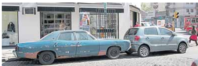
Tokių mašinų Argentinoje daug

Argentinoje yra labai nesaugu turistams, apsisaugoti nepavyko. Žinojome, kad taip pat nesaugu bus ir Brazilijoje. Juodu humoru juokaujama, kad jeigu plėšikui patiks jūsų laikrodys - nupjaus su ranka. Tačiau tai neatėmė mums noro pabuvoti Argentinos garsiosiose milongose - tango vakarėliuose, kurie prasideda vidurnaktį, prieš tai socialiai pavakarieniavus. Išraiškingą tango poros demonstruoja ir gatvėse.