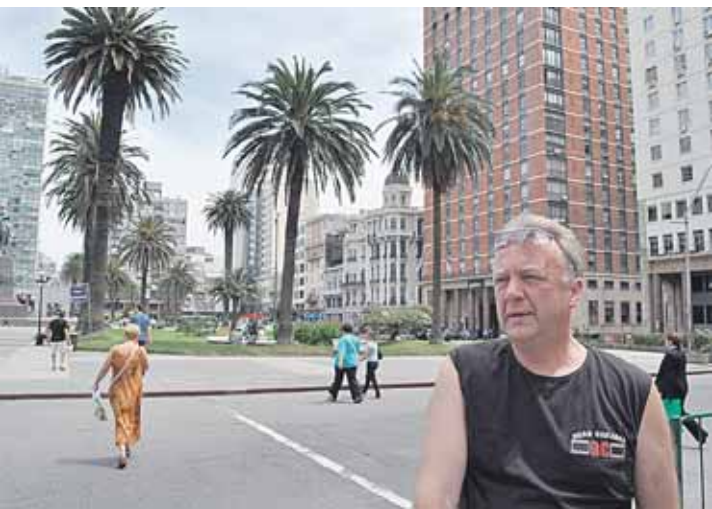
▲ Urugvajaus sostinės Montevideo centrinėje aikštėje