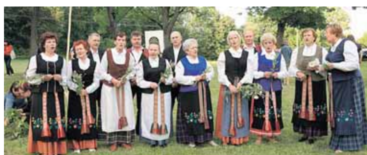
Dainuoja Leipalingio laisvalaikio salės folkloro ansamblis "Serbenta"