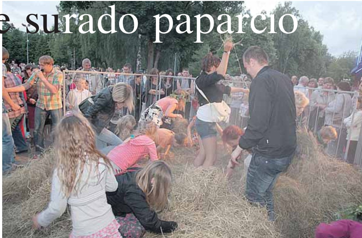
Įnirtingos paparčio žiedo paieškos