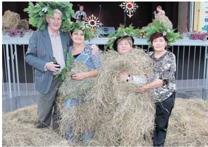
„Šieno rūbų“ autoriai su „manekenėmis“