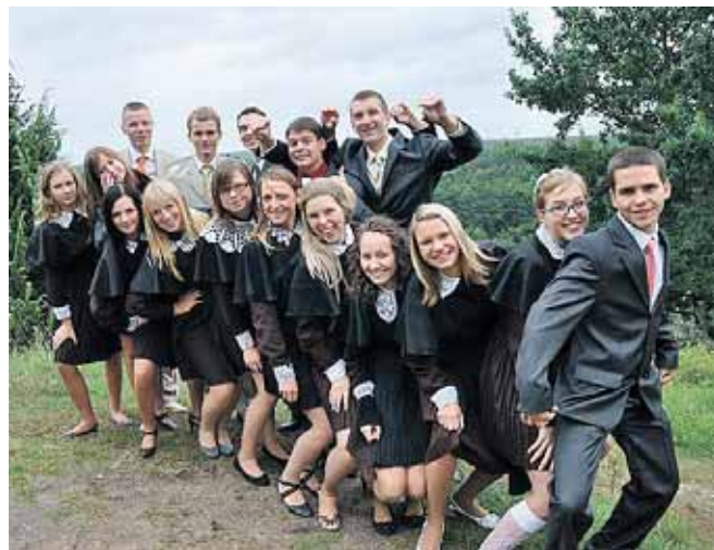
63-osios laidos abiturientai

Prieš 12 metų daugiau nei 100 mokinukų peržengė „Atgimimo“ vidurinės mokyklos slenkstį. Lydimi tėvelių, nedrąsiai įžengė į savo 1-ąją klasę ir susipažinome su savo pirmąja auklėtoja. Dar ir šiandien prisimenam, kaip stipriai spaudėm mamos ranką, nes nežinojom, kas mūsų laukia būsimojus 12 metų. Dabar jau esam suaugę, bet visa tai yra tėvų ir mokytojų įdirbis. Su didžiausia pagarba norim padėkoti visiems „Atgimimo“ vidurinės mokyklos mokytojams ir pakviesti juos į 63-ios laidos atstatytą įteikimo šventę, kuri vyks š. m. liepos 13 d. 18 val. „Grand Spa Lietuva“ konferencijų salėje.