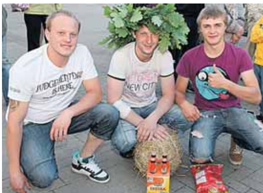
„Šienkrepšio“ nugalėtojas su draugais