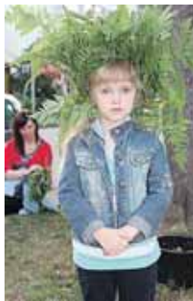
Kokios Joninės be „Šienkrepšio“?