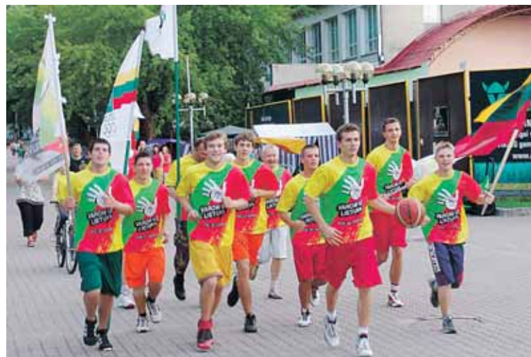
Įžaidėjų druskininkiečių Vilniaus alėja varomas kamuolys