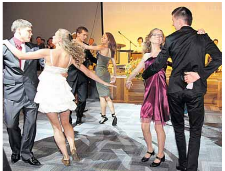
Mokyklinio valsio sukury