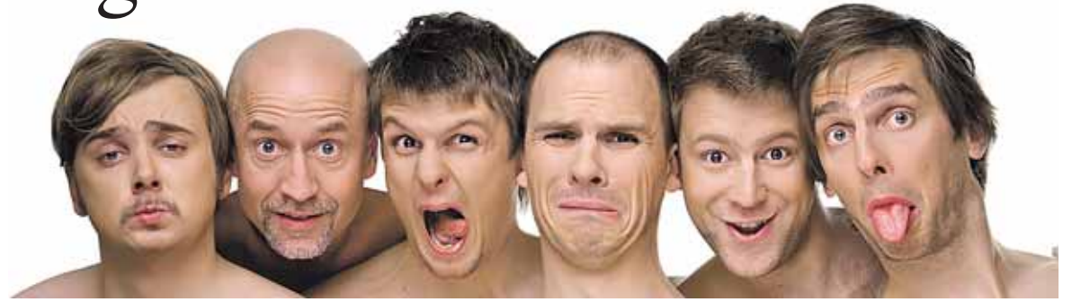
Vyrukai iš improvizacijų teatro "Kitas kampas"