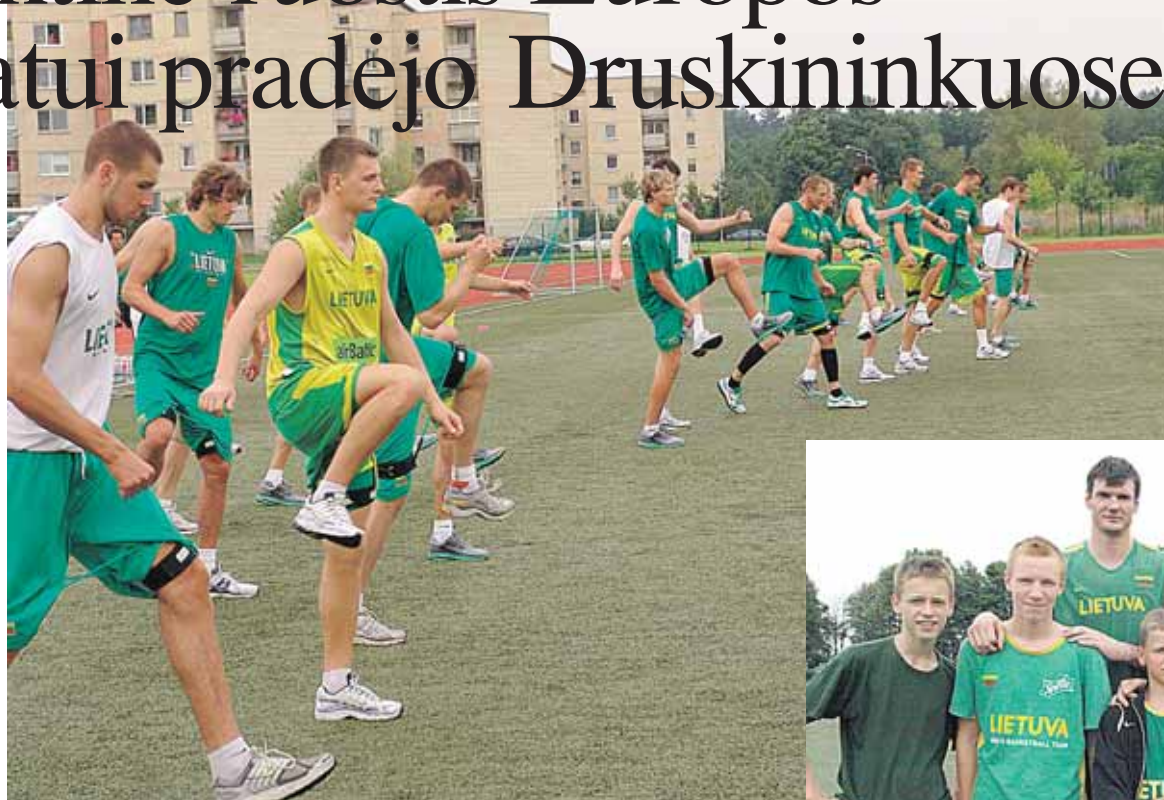
Treniruotė stadione prie "Saulės" pagrindinės mokyklos