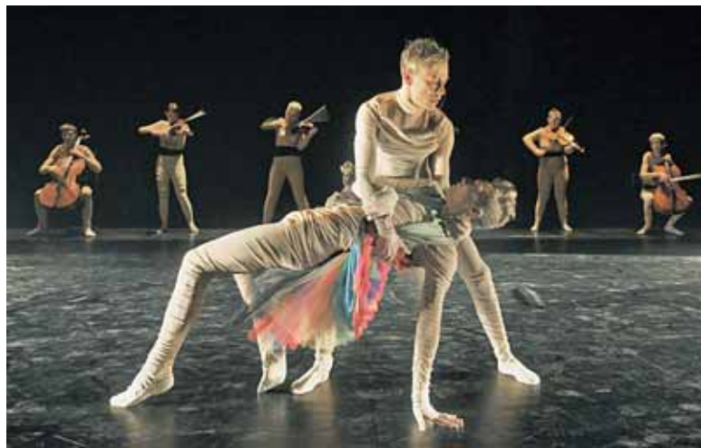
„Paukščių“ šokio kompozicija

Teatro „Atviras ratas“ kompanija spektakliu „Antigonė (ne mitas)“ perrašo antikinę mitologiją