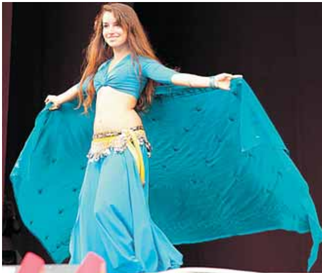
Pilvo šokius gali šokti bet kokio amžiaus ir figūros moterys. Kuo šokėja apkūnesnė, tuo ji gražiau atrodo scenoje