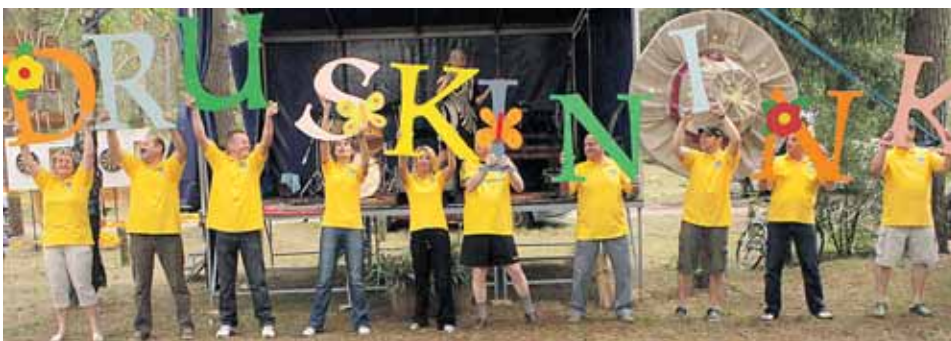
Prisistato Savivaldybės tarybos ir administracijos komanda