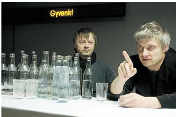
Scena iš spektaklio „Dugne“