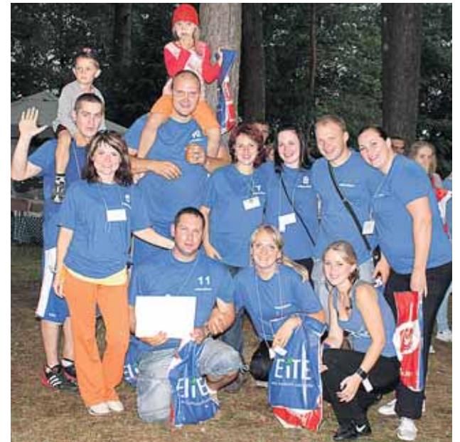
Jaunatviška Viečiūnų bendruomenės "Versmė" komanda užėmė 2-ąją vietą