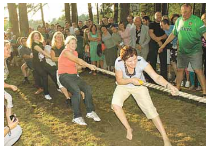
Atkaklios ir ryžtingos Neravų moterys, traukdamos virvę, mažai tenusileido vyrams