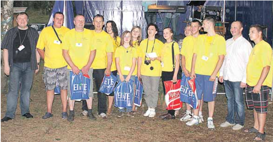
Pagrindinį prizą - pakvietimus į slidinėjimo areną - laimėjo Stračiūnų bendruomenės komanda

Kol buvo sumuojami galutiniai rezultatai, šventės dalyviai gardžiausi keptu veršeliu. Apskritai, be sportinių emocijų, šventėje buvo galima ne tik seniai regėtą žemietį pakalbinti, vaišintis, varžybose sirgti už savus, bet ir dalyvauti loteri-