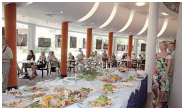
Atidarymo proga - gausus vaišių stalas