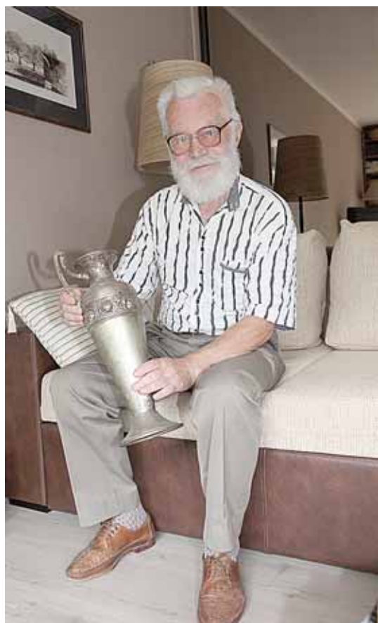
Barzda, vyriškumo ir išminties simbolis, tapo neatskiriamą Vaclovo įvaizdžio dalimi

šimties. „Baigęs Šiaulių pedagoginiame institute defektologiją, išvažiavau mokyti ir aspirantūrą Leningrade. Reikėjo man, kaip vadovui, lydėti pirmakursius studentus vasaros darbams į kolūki prie Lūgos. Merkė mus ten lietus, kamaivo pelkės ir uodai. Miegodavom pasikloję šiaudus. Nebuvo jokių sąlygų normaliai nusiskusti, tai ir užaugo per pusantro mėnesio nemaža barzda. Grįžau į Leningradą, o ten vienas pagyvenęs dėstytojas ir sakys: „Gražiai atrodai. Daug solidesnis“. Patiko tas jo pagyrimas, ir likau su barzda visam gyvenimui. Nesigailiu: skustis kasdien nereikia, belieka tik žirkliuotėmis palyginti, padailinti kartą kitą per mėnesį“. Ar niekas per šitiek metų nepatraukė per dantį, kad vaikšto visas plaukais apžėlęs? „Jei kas ir bandydavo pasišaipyti,