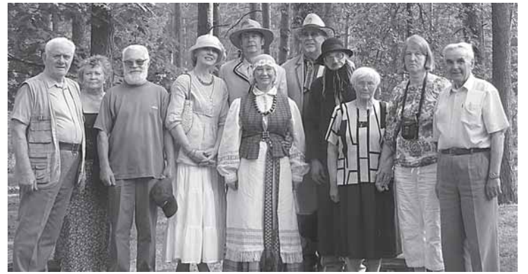
Monografijos apie Druskininkus talkininkai

„Vermės“ leidykla sudaryti monografiją apie Druskininkus patikėjo doc. dr. E. Mažintui. Dėmesingos ir paslaugios knygos sudarymo pradžios etape buvo