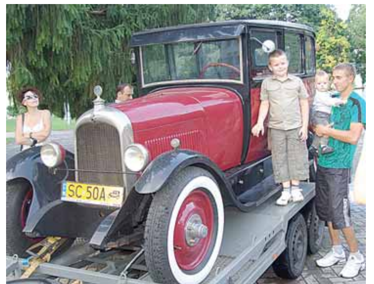
Prie senovinių automobilių, atvykusių iš Lenkijos ir apsistojuusių Pramogų aikštėje, noriai fotografavosi druskininkiečiai ir miesto svečiai