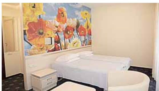
Vilos „Kolonada“ kambariai pražydo gėlėmis