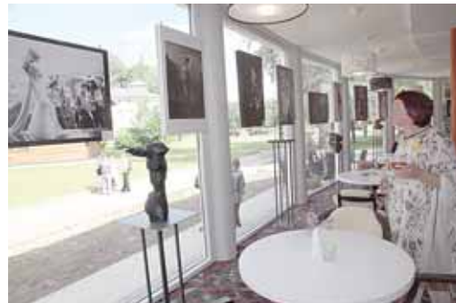
Kavinė „Mūza“ - tikra meno galerija