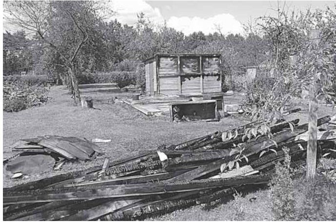
Nuo žaibo apdegęs namelis Rūtų g.18 „Raigardo“ sodų bendrijoje

Kaip žinia, praėjęs liepos mėnuo buvo „dosnus“ liūčių, vėtrų, žaibų, griaustinių. Tai besąlygiškai atsiliepė Druskininkų ugniagesių gelbėtojų darbui.