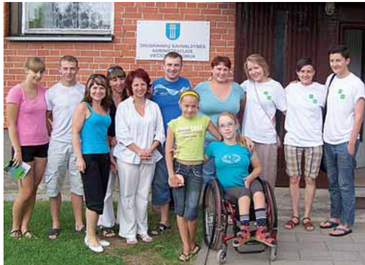
Viečiūniškiai su „Jaunimo linijos“ savanoriais

Savanoriai išsamiau papasakojo apie projektą „Emocinė parama 100-ai Lietuvos miestelių“, iš kurių vienas yra būtent Viečiūnai. Kaip žinia, mažuose miesteliuose ir kaimuose beveik nėra