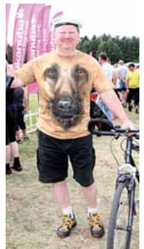
Mylintiems šunis nebūtina juos auginti