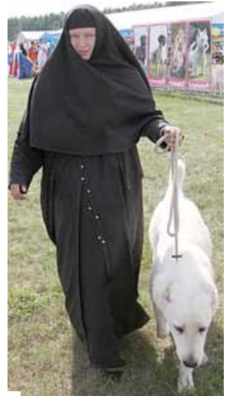
Daugelio akys krypo į varžybose su savo retriveriu dalyvavusių vienuolę