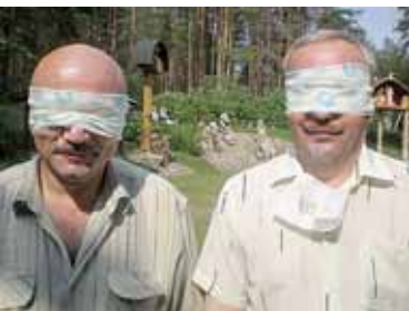
Jogurtų valgymo užrištomis akimis varžybų dalyviai