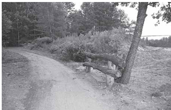
Buvo apsemtas dviračių takas Švendubrėje