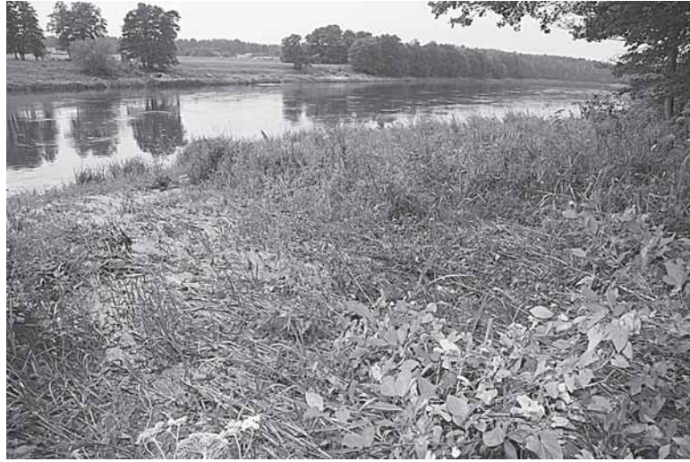
Vijūnėlės vanduo patenka į Nemuną

„Skęsta Švendubrės apylinkės, miške liejasi purvas ir vanduo“, – nuo švendubrėnų skambučių praėjusią savaitę kaito „Druskonio“ redakcijos telefonas. Paaiškėjo, jog rugpjūčio pradžioje Švendubrėje buvo pralaužtas iš Vijūnėlės tvenkinio siurbiamo dumblo rezervuaras, į mišką išsiliejo purvas, o praūžusi liūtis išplovė vandens rezervuaro apsauginį pylimą ir vanduo klioktelėjo dviračių taku Nemuno link.