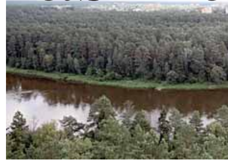
Pro panoraminio restorano langus atsiveria