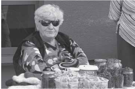
Grybai ir uogos parduavinėjami Druskininkų turguje

Druskininkų turguje prekiaujančiųjų miško gėrybėmis išties nemažai – daugiausia moterys, kurios pačios parduodamas uogas rinkusios. Patikrinti, ar taip iš tikrųjų yra, nesunku. Pasiklausus, kuriame būtent iš aplinkinių miškų rinkti grybai ar uogos, atsakymo rišlumas išduoda pardavėjo sąžiningumą. Nesugebanti nustatyti parduodamų bruknių nuskyrimo vietos už litrą šių uogų nuo šešių iki aštuonių litų prašanti moteriškė tikriausiai nuslepia ir gėrybių rinkėjo tapatybę, nes aki-vaizdžiai nėra gerai informuota apie bruknių šviežumą. Tačiau uogų “amžių” nustatyti nėra sudėtinga –