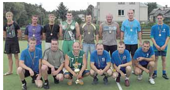
Futbolo varžybų prizininės - Viečiūnų ir Leipalingio seniūnijų komandos