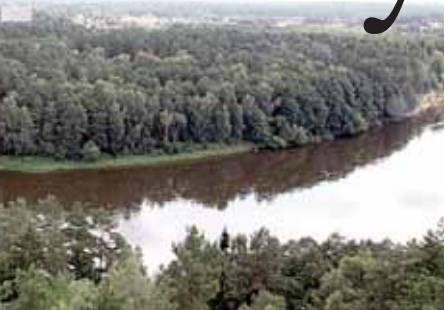
...ia visi Druskininkai