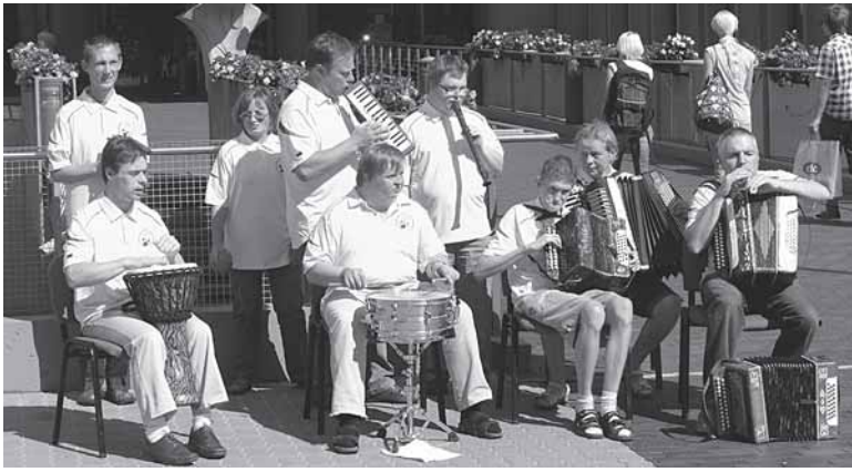
Neįgalieji muzikantai ir stovyklautojai prie Druskininkų vandens parko

Rugpjūčio 14-21 d. Druskininkuose vėl šurmuliavo tradicinė muzikinė stovykla, kurioje dalyvavo 58 dalyviai iš Vilniaus, Šiaulių,