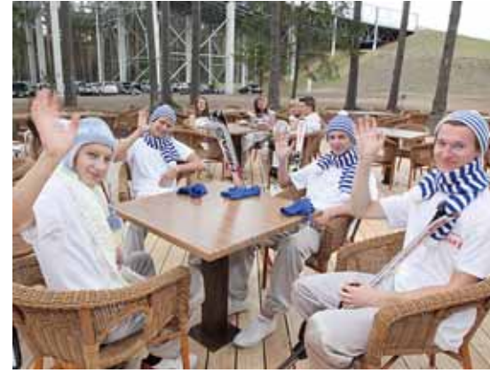
Atsipūsti po žiemos pramogų galima jaukioje lauko kavinėje

kių cheminių ir bakterinių priedų. Ši technologija suteikia galimybę aprūpinti slidinėjimo trasas aukščiausios kokybės sniegu išstisus metus. Sniego gamybos sistema yra automatizuota, kontroliuojama bei valdoma nuotoliniu būdu. „Snoras Snow arenoje“ įrengti šveicariški kalnų keltuvai. Prie sniego arenos įrengta 380 transporto stovėjimų vietų.