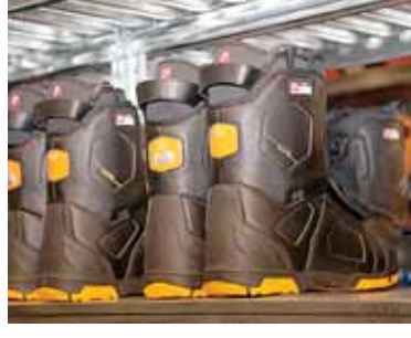
Slidinėjimo batai laukia lankytojų

Slidinėjimo trasų sniego gamybai naudojama „PowderStar Series“ technologija, pagal kurią sniegas gaminamas naudojant suspaustą orą ir šaltą vandenį be jo-