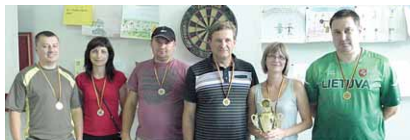
Smiginio varžybų prizininės iš Viečiūnų ir Leipalingio seniūnijų