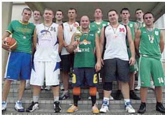
Krepšinio 3/3 varžybų prizininės - Viečiūnų ir Leipalingio seniūnijų komandos

● Pasibaigė Lietuvos seniūnijų I etapo sporto žaidynės Druskininkų savivaldybėje , kurias finansavo asociacija „Sportas visiems“. Šiose žaidynėse galėjo dalyvauti tik seniūnijų gyventojai. Vyko įvairių vyrų ir moterų amžiaus grupių 7-ių sporto šakų varžybos: krepšinio 3/3; futbolo 5/5; parko tinklinio 3/3; šaškių; stalo teniso; smiginio; virvės traukimo. Susumavus visų sporto šakų rezultatus, bendroje įskaitoje Lietuvos seniūnijų I etapo sporto žaidynių Druskininkų savivaldybėje nugalėjo tapo Viečiūnų seniūnija.