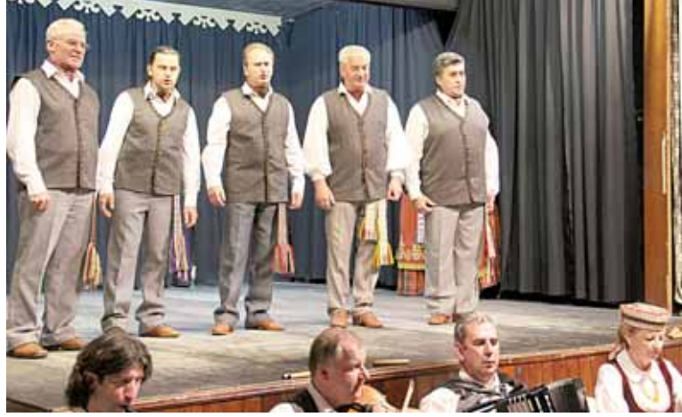
Su ansambliu "Dainava" teisėjas (centre) pamatė daug pasaulio šalių