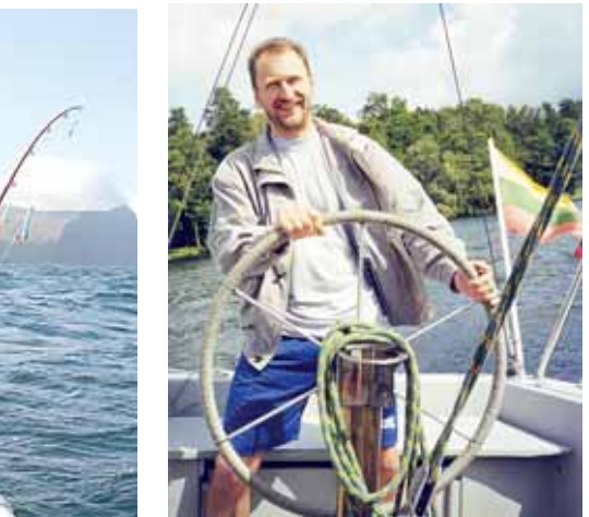
Buriuojant Galvės ežere