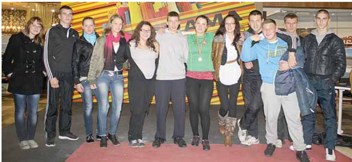
Druskininkų „Ryto“ gimnazijos rankų lenkimo komanda, dalyvavusi tarptautiniame turnyre „Vilnius 2011“

Čempionate dalyvauja šios komandos: SK „Planas“, „Atgimimas“, Druskininkų SC-94, „Techpro“, „Alėjos Ažuolas“, „Gardino 21“, „Kolegija/Atėitis“, Druskininkų SC-95, „Pasienis“, „AKK“, „Viečiūnai“, Druskininkų SC-96, SK „Leipas“, „Troškulys“. Artimiausios čempionato rungtynės vyks lapkričio 8 d. (antradienį) sporto centro salėje: 18 val. „Alėjos Ažuolas“ - „AKK“; 19.20 val. SK „Planas“ - „Troškulys“; 20.40 val. „Viečiūnai“ - „Techpro“. Lapkričio 13 d. (sekma-