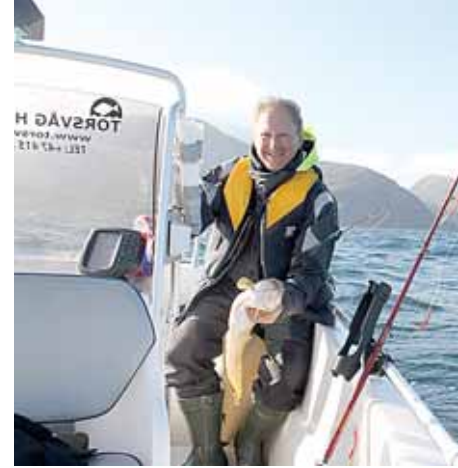
Koks vyras nemėgsta žvejoti?

- Jau penkiolika metų užimate aukštą teisėjo pareigas Vilniuje. Niekad nekilo minties pasieškoti sklypo kur nors šalia Turniškių ar kitoje prestižinėje sostinės vietoje? Kam, atrodytu, jums toks čigoniškas gyvenimas – pusę savaitės Vilniuje, pusę – Druskininkuose?