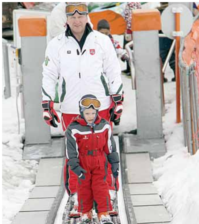
Tėtis su sūnumi - aistringi slidininkai