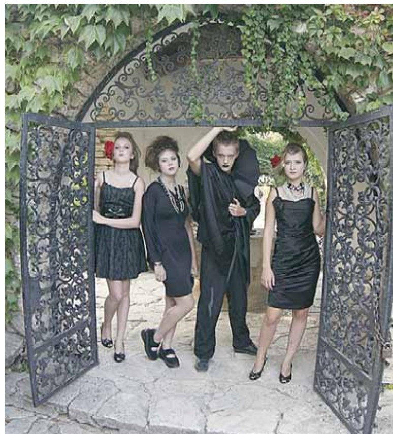
Druskininkiečių gotikinė fotosesija botanikos sode

Kiekvienos šalies pagrindinis tikslas buvo savo sukurtą darbą suderinti su kitos grupės kūriniais, išdailinti ir jį pristatyti paskutiniame vakare savitai improvizuojant. “Mes, lietuviai, sukūrėme gotiško stiliaus suknelę su įvairiais gotiško stiliaus elementais. Modeliavome ir siuvome visi, puikiai dirbo kartu vaikinai, - dalijasi išpūdingais D. Van Gucht. - Kiekvieną dieną susipažindavome su kitų atliktu darbu, dalinomės idėjomis, siūlėme savo mintis. Čekai mūsų gotiškajai suknei pritaikė spalvoto stiklo karoliukus, kitus aksesuarus. Ypač patiko gotikinė fotosesija - mes patys buvome modeliai, o makiažą darė bulgarės,