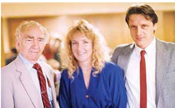
1993 m. Vytautas Dabukas su poetu Bernardu Brazdžioniu ir jo anūke Amerikoje

dinęs jį po tarpeklių, tragiškai nukrito kartu su keleiviais.