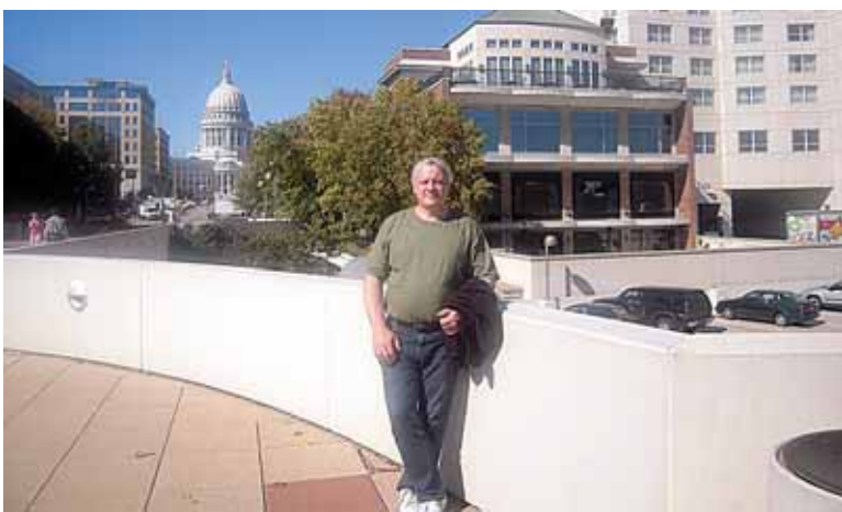
Dukra ir žentas dirba prestižiniame Madisono klube (dešinėje), esančiame netoli nuo kapitolijaus (kairėje)