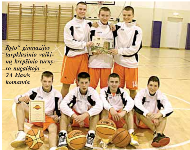
Ryto“ gimnazijos tarpklasinių vaikūnų krepšinio turnyro nugalėtoja – 2A klasės komanda

Artimiausios 2011/2012 m. Druskininkų savivaldybės vyrų krepšinio čempionato rungtynės vyks lapkričio 22 d. (antradienį) Sporto centro salėje: 18 val. „Troškulys“ - „Gardino 21“; 19.20 val. Druskininkų SC-94 - „Techpro“; 20.40 val. „Alėjos Ažuolas“ - „Atgimimas“. Lapkričio 27 d. (sekmadienį) „Ryto“ gimnazijos sporto salėje (Klonio g. 2): 11 val. „Pasienis“ - „Viečiūnai“;