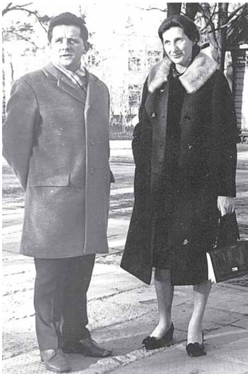
Bestatant naująsias gydyklas su maskviete projektuotoja