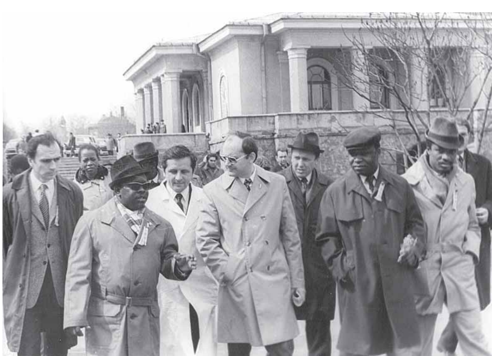
1975-76 m. Druskininkus apžiūri delegacija iš broliškos Angolos

liuosi ir šuniukas išveda mane į mišką. Taip ir prasideda mano judėjimas. Automobilius turiu net du, bet stengiuosi kuo daugiau vaikščioti pėsčiomis, kol durnumas neužena. Ką tai reiškia? Durnumu vadinu, kai važiuoti labai norisi, skubėti.