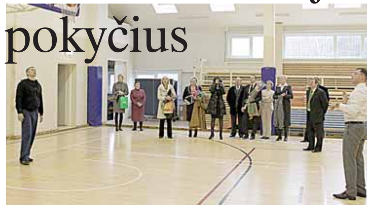
“Ryto” gimnazijoje ministras G.Steponavičius mėtė į krepšį

“Ne pirmą kartą lankausi Druskininkuose, bet anksčiau atvykdavau daugiau asmeniniais tikslais, todėl džiaugiuosi, galėdamas susitikti su visu švietimo darbuotojų būriu ir aptarti švietimo aktualijas šalyje, o tuo pačių ir jūsų kurorte”, - kalbėjo švietimo ir mokslo ministras Gintaras Steponavičius, lapkričio 18-ąją lankydamasis mūsų mieste ir Savivaldybės administracijos salėje susitikęs su vietinių švietimo įstaigų vadovais.