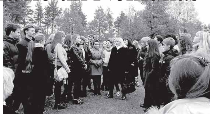
Bendros dainos ant Liškiavos piliakalnio

Spalio 20-21 d. į „Atgimimo“ vidurinę mokyklą atvyko rusų kalbos projekto „Mus jungia Nemunas“ dalyviai iš Baltarusijos, Gardino 1-osios gimnazijos. Šis susitikimas jau ne pirmas - per ketverius metus druskininkiečiai ir gardiniškiai jau spėjo susidraugauti, į projektą įtraukti daug naujų dalyvių.