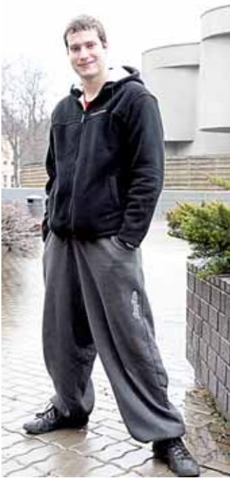
Šalies vadovės dėmesį patraukė neformali fotografo apranga - plačios, gatvės šokėjų stiliaus kelnės

Kai apie Prezidentės komplimentą sportinio stiliaus kelnėms sužinojo slidinėjimo trasų darbuotojai ir Audrius draugai, vaikinai buvo apipiltas klausimais, kas čia per aprangą, patraukusi net ir šalies vadovės dė-