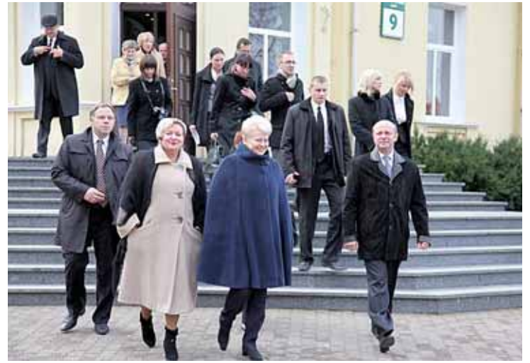
Kurorte viešėjusi Prezidentė pirmiausiai užsuko į Savivaldybę

Lapkričio 10-ąją Druskininkuose viešėjusi šalies prezidentė Dalia Grybauskaitė į Vilnių išvažiavo ne tuščiomis rankomis. Be simboliškų dovanų namo jos neišleido visi aplankyti kurorto objektai: Savivaldybė, Druskininkų gydykla bei žiemos pramogų kompleksas „Snoras Snow Arena“.