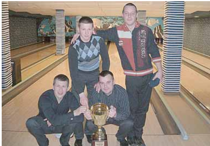
„SPA Vilnius 1“ komanda kalėdiniame boulingo turnyre užėmė 4-ąją vietą