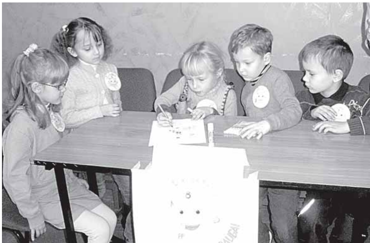
Konkurso "Sveikuolių sveikuoliai" komandos

Tarptautinio vaikų, mokinių, pedagogų ir visuomenės sveikatos priežiūros specialistų konkurso „Sveikuolių sveikuoliai“ 1-asis etapas Druskininkuose jau baigėsi. 4-iose mokinių amžiaus grupėse varžėsi 8 komandos iš Druskininkų savivaldybės ugdymo įstaigų. Kiekvienos grupės nugalėtoja kitais metais vyks į 2-ąjį šio konkurso etapą.