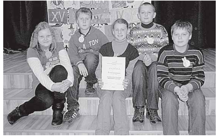
Matematikos linksmosios olimpiados nugalėtoja - 5d klasės komanda

Niūrią lapkričio 25-osios popietę „Saulės“ pagrindinės mokyklos 5-okai po pamokų nesukubėjo namo, nors jau galėjo planuoti papildomų atostogų savaitės pramogas. Nuaidėjęs paskutinės pamokos skambučiui, visi sugužėjo į salę, kur prasidėjo linksmoji viktorina, parengta mokyklos matematikos mokytojų metodinio būrelio.