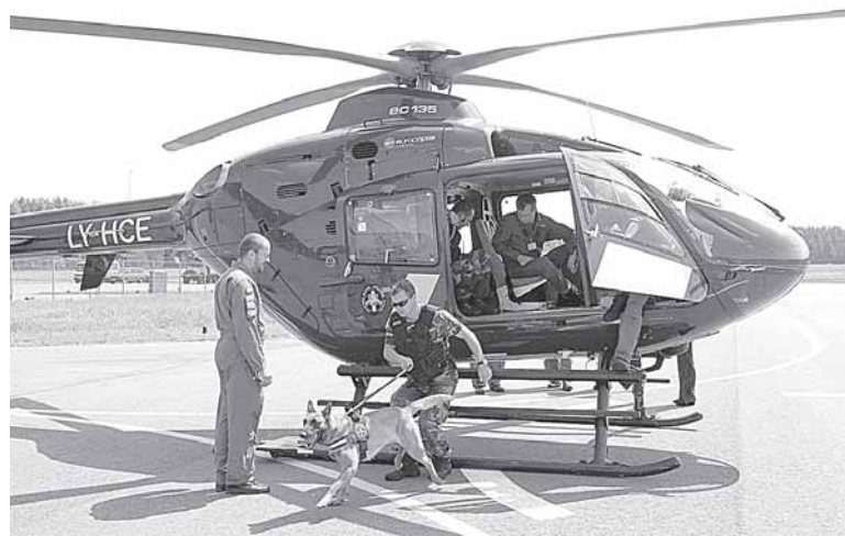
Modernia įranga aprūpinti VSAT sraigtasparniai

„Kaip rodo kitų ES šalių aviacijos pajėgų patirtis, sraigtasparnių panaudojimas gali būti labai naudingas nustatant tranzito tvarkos pažeidimus, tokius kaip bandymai išsilaipinti iš traukinio, taip pat prekių metimą iš traukinio. Oro pajėgos ženkliai palengvina darbą