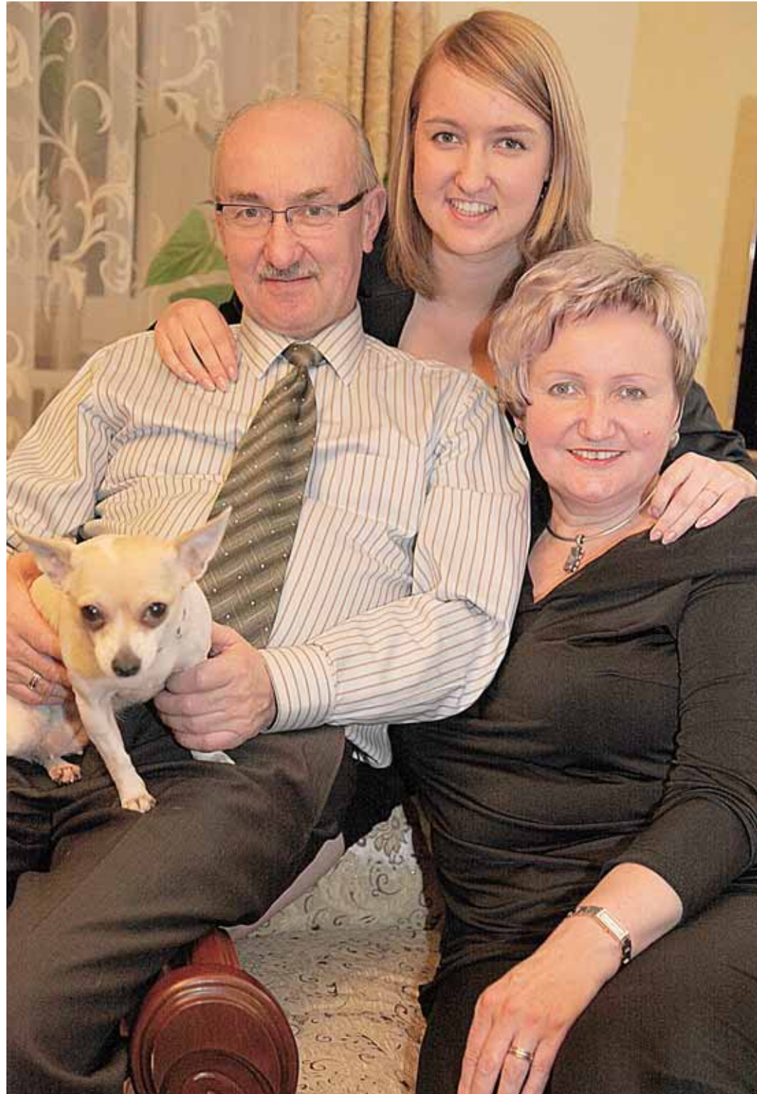
„Mano namai ir brangiausi žmonės čia – Druskininkuose“, - apsikabindama mamą ir tėtį, šypsosi mergina

Žinojau, kad Australijos universitetų lygis – labai aukštas, kad ten praleistas laikas nenueis veltui. Magėjo išmėginti tą akademinį studijų stilių, koks taikomas šios šalies aukštosiose mokyklose. Be to, norėjau pamatyti platųjį pasaulį, pažinti senąją aborigenų kultūrą, pasigerėti nepaprastai gražia Australijos gamta. O kai atsiranda tokia proga, kodėl stovėti ir