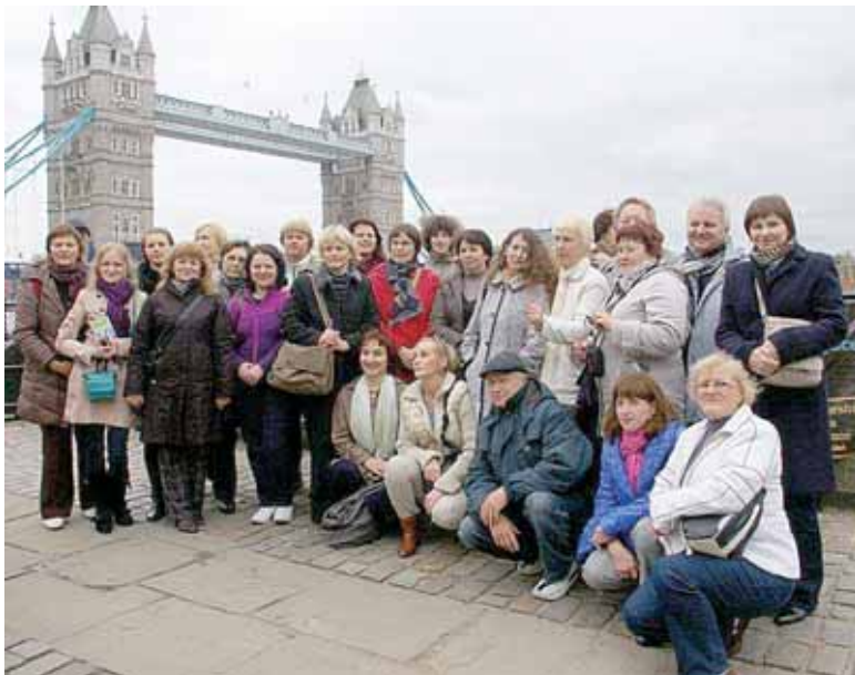
Kurorto pedagogai Londone

Druskininkų mokyklų 34 pedagogai spalio pabaigoje turėjo galimybę pasigrožėti Londonu ir domėtis Jungtinės Karalystės Bafo mieste esančios Culverhay mokyklos pedagogine partimi.