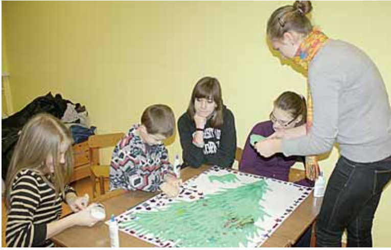
Ryšėja gimnazistų ir globos namų vaikų drauge daroma delniukų eglutė