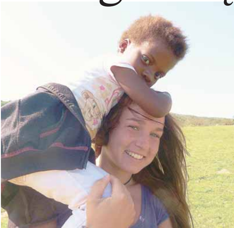
Viltė su mažąja afrikiete

- Į Vokietiją išvažiavau turėdama tik anglų kalbos pagrindus, todėl pusę metų toje teniso mokykloje teko gerokai pavargti. Bet su lietuvių-vokiečių kalbų žodynu pavyko įveikti visas mokslo kliūtis, o teniso kortuose kalbėti daug juk