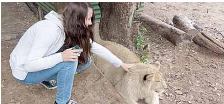
Liūtus prižiūrėjusi druskininkietė jų nebijojo

neriekia. Tėvai, mane nuvežė į Štutgartę, namo grįžo ramūs. Patekau į rimtą, uždara mokyklą, kurioje vaikus visą parą prižiūri atsakingi darbuotojai. Visą laiką gyvenau tenisu, siekiau maksimalių rezultatų. Po metų aš nusprendžiau persikelti į teniso mokyklą Ispanijoje, turinčioje puikius šios sporto šakos trenerius. Buvau laiminga, patekusi į žymiausių Ispanijos tenisininkų kalvę - Katalonijos federacijai priklausančią teniso mokyklą Barselonoje. Taip, būdama dvylikametė, atsidūriau saulėje Ispanijoje, kurią iškart įsimylėjau – dėl saulės, šilumos, besišypsančių žmonių, draugiškos atmosferos. Pasiekimai teniso varžybose buvo neblogi: pagal reitingą buvau 120-a Europoje tarp sportininkų iki 16 metų. Penkerius metus pliekiau teniso rakete šioje Barselonos mokykloje. Bet vis dažniau aplankydavo mintis, jog visą gyvenimą atiduoti vien tik tenisui nebeturiu. Supratau, kad noriu mokytis normalioje mokykloje, gauti gerą išsilavinimą, įstoti į gerą universitetą.