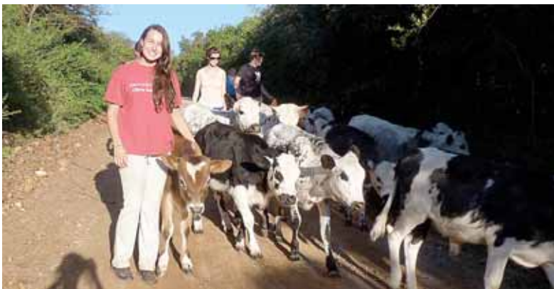
Afrikos karvės varomos į ganyklą