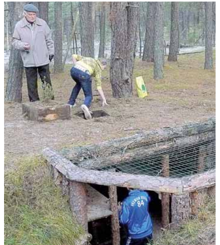
Varžytuvėse moksleiviai skubėjo kuo greičiau išlįsti iš partizanų bunkerio pro landą