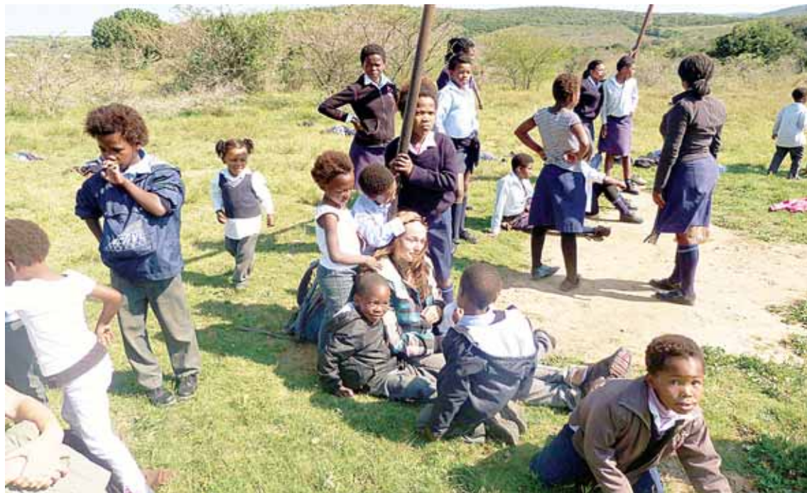
Afrikos kaime mokytoja savanore savaitę dirbusią druskininkietę vaikai čiupinėjo ir glostė tarsi baltą stebuklą

bu išsinuomoti butą, susitarti dėl nuomos kainos. Dabar gyvenu puikioje vietoje – pačiame Barcelonos senamiestyje, šalia Ramblos - pagrindinės miesto gatvės. Viską moku ir galiu susitvarkyti pati. Kartais ir iš mamos pasijuokiu, kai ji susirūpina, kur aš drabužius išsiplausiu: „Juk tam, mama, skalbimo mašinos yra“. Iš šono gal ir atrodo baisiai, ar toks vienuolikos metų vaikas galės vienas išgyventi, kad ir Europos didmiesčių džunglėse? Žinokit, nieko baisaus tikrai nėra. O vaikai nėra tokie bejėgiai naivuoliai, kaip kartais suaugusiems atrodo.