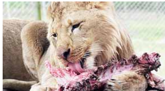
Mergina iš arti matė Afrikos liūtų kasdienybę