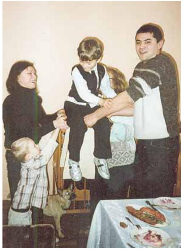
Vaikų šėlionė su tėvais