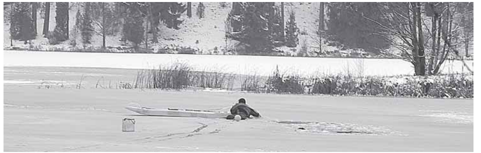
Gelbėtojas-naras ieško skenduolio ant Seiros upės ledo sausio 19-ąją

Sausio 19-osios popietę, apie 14 val., Druskininkų priešgaisrinei gelbėjimo tarnybai pranešta, kad Seiros upės ledo properšoje gali būti nuskendęs žmogus. Juo lab šalia jos, apie 30 m nuo kranto, buvo palikta žvejo dėžutė. Tokius įtarimus pravažiuojantiems žvejams sukėlė Seiros upės vieta mūsų savivaldybės teritorijoje, apie 5 km nuo Juodojo Bilso ežero link Baltosios Ančios elektrinės, kur ant išplatėjusios upės ledo neretai susiburia dešimtys žvejų, dažnųsyk traukiantys iš vandens karšius ar ešerius.