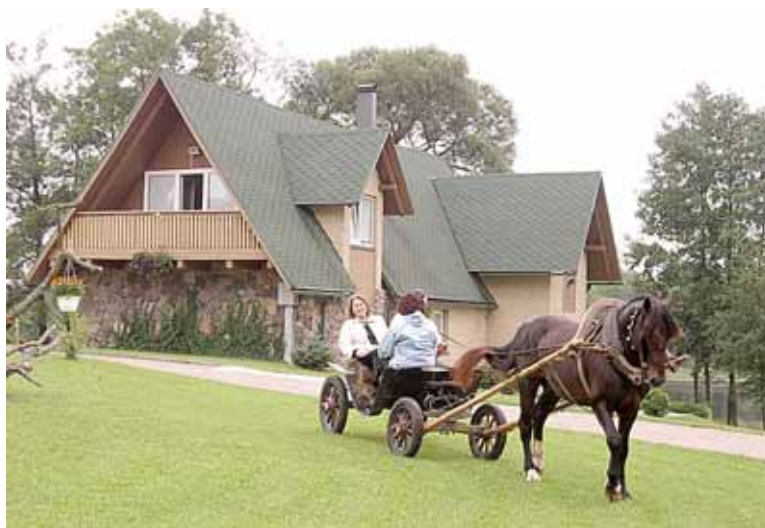
Gyventojų pramogomis ir laisvalaikio besirūpinančios bendrovės „Abuva“ vadovai sako, kad renkant saugos paslaugų tarnybą svarbiausia buvo jos reputacija, specialistų kompetencija ir naudojamos technologijos

„Pradėję naudotis paslaugomis pastebėjome, kad saugos tarnybos „Ekskomisarų biuras“ stiprybė – technologiniai sprendimai ir gerai organizuotas darbas. Atradome daug patogių naujovių, kurių ne-