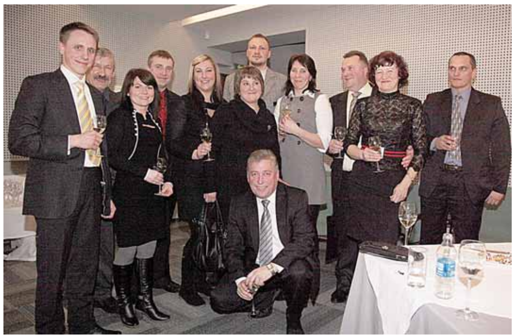
„Mes - jungtinė Druskininkų bendruomenė“, - juokavo kaimiškų Savivaldybės teritorijų atstovai