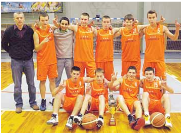
„Ryto“ gimnazijos klasė varžysis Alytaus apskrities bendrojo lavinimo mokyklų klasių krepšinio varžybų Druskininkų savivaldybės taurei laimėti 3-ame etape