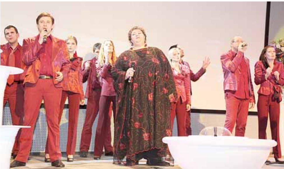
Dovana vakaro svečiams - Kauno Burgundiškojo choro koncertas