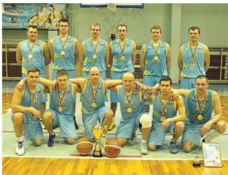
Druskininkų savivaldybės krepšinio čempionato nugalėtoja - komanda „Alėjos Ažuolas“