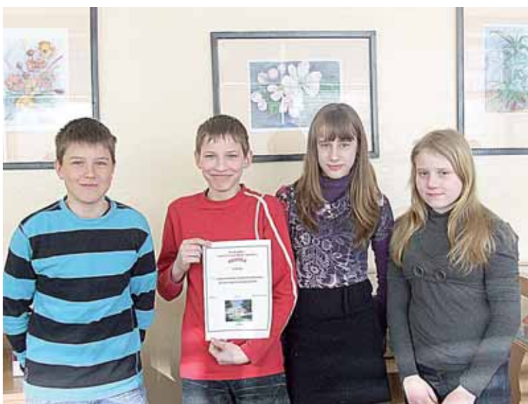
Viktorinos nugalėtoja - 6c klasės komanda

Viktorinos nugalėtojais tapo 6c klasės mokiniai. Nedaug nuo jų atsiliko 6a ir 6b klasių komandos. Svarbiausia yra ne tai, kam teko 1-oji vieta, o tai, kad visi dalyviai šią popietę išėjo laimėtojais – jie pagilino savo istorijos žinias, patyrė kūrybos džiaugsmą, išreiškė meilę savo gimtajam kraštui.