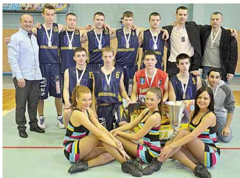
Druskininkų „Ryto“ gimnazijos 2a klasės komanda Alytaus apskrities bendrojo lavinimo mokyklų klasių krepšinio turnyre Druskininkų savivaldybės taurei laimėti iškovojė 2-ąją prizą

● „Druskininkų Puma pusmaratonyje“ gegužės 6 d. bus daug smagių naujovių, skirtų ne tik profesionalams, bet ir mėgėjams, aktyvioms šeimoms bei mažiesiems bėgikams. Šventėje kartu su profesionalais ir šios sporto šakos mėgėjais bus galima įveikti šiaurietiško ėjimo trasas. Čia, 5 ir 11 kilometrų distancijose, reikės varžytis tik su savimi. Šiaurietiško ėjimo varžybose nereikės įveikti kitų. Renginyje gali dalyvauti ir tie, kurie niekada rankose nelaide šiaurietiško ėjimo lazdų. Šventėje dalyvaus instruktoriai, kurie ėjimo metu galės patarti bei paaiškinti šiaurietiško ėjimo klaidas. Jeigu sugalvojote dalyvauti „Druskininkų Puma pusmaratonyje“ renginiuose pirmiausiai užsiregistruokite: www.druskininku-pusmaratonis.lt .