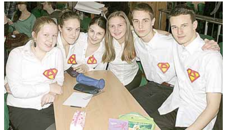
Matematikos viktorinos nugalėtoja – 1 a klasės komanda

Kiekvienais metais matematikai ir kiti tikslųjų mokslų atstovai švenčia pi (π) dieną. Kovo 14-oji šiam skaičiui paminėti pasirinkta dėl jo reikšmės -3,14. Šis skaičius yra bene labiausiai žinomas visame pasaulyje.