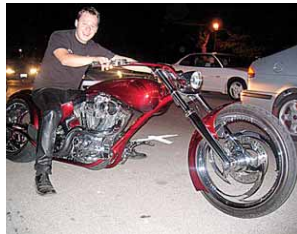
Modestas motociklų parodoje