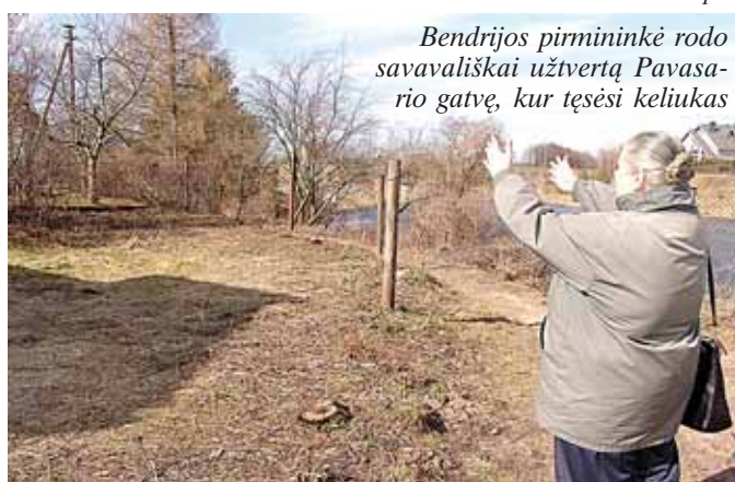
Bendrijos pirmininkė rodo savavališkai užtvirtą Pavasario gatvę, kur tęsiasi keliukas

Didžioji dalis sodininkų bendrijos „Dainava“ gyventojų atsidūrę nepavydėtinoje padėtyje. Jie laužo mašinas, važinėdami dėl nesibai giančių vandentiekio tiesimo darbų iškasinėtose gatvėse. 4 psl.