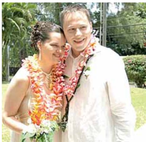
Havajuose jaunavedžiams ant kaklo buvo užkabintos tradicinės gėlių girliandos