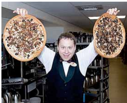
Modestas pirmosiomis savo darbo dienomis Amerikoje