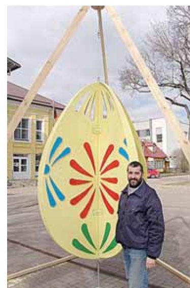
Margutis, pildantis norus