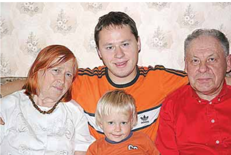
Modestas su tėvais ir sūnumi