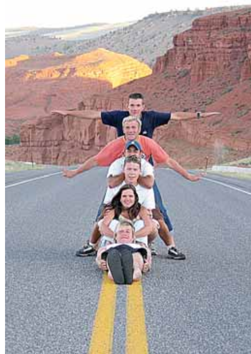
Po Ameriką pora dažniausiai keliaudavo su bičiuliais druskininkiečiais