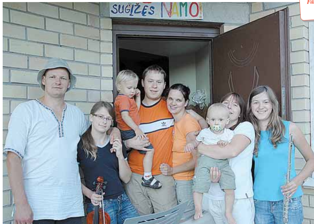
Modestą ir Akvilę, sugrįžusius iš Amerikos, gimtuose namuose pasitiko visas druskininkiečių būrys