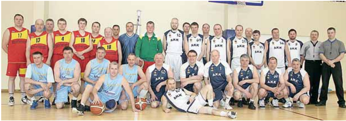
Komandos, Druskininkų „Aktyvaus krepšinio klubo“ vyrų krepšinio turnyro, skirto Lietuvos krepšinio 90-čiui paminėti, dalyvės

mergaičių 1 km distancijoje Reda Bertiškaitė iškovojo 4 vietą (rez: 5:20,0), Andra Tamašauskaitė – 12-ąją.