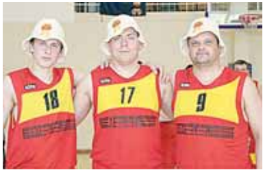
„Lagūnos“ krepšininkai, konkurso „Vienas už visus, visi už vieną“ nugalėtojai