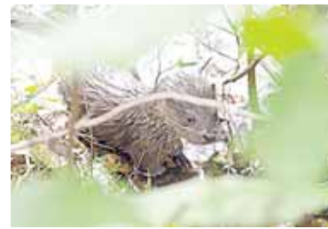
Ūdriukas Alkos tvenkinyje

Retas Druskininkų miškų paukštis – gargatūnas, tetervino ir kurtinio mišrūnas