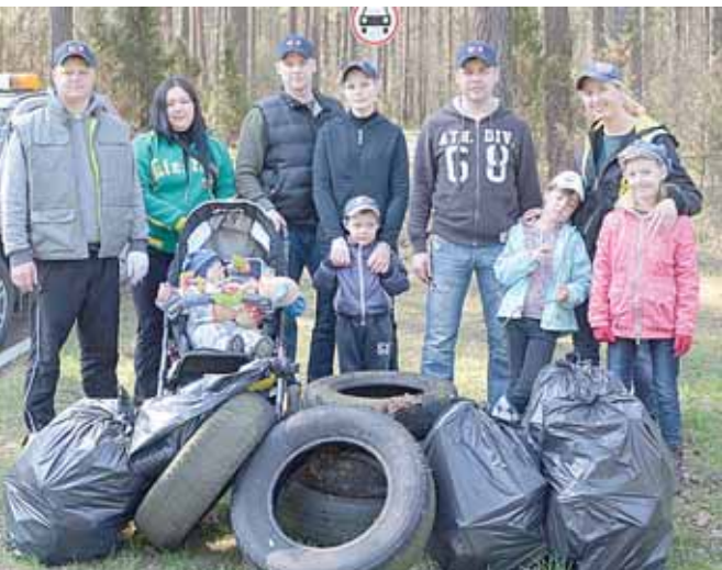
Apsaugos tarnybos darbuotojai su šeimomis