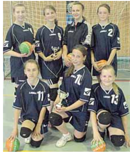
„Atgimimo“ vid. mokyklos rankininkės, 2012 m. tarpmokyklinių rankinio varžybų nugalėtojos

● Gegužės 7,10,14 d. sporto centre vykusiose 15-mečių ir jaunesnių mergaičių tarpmokyklinėse rankinio varžybose , ku-