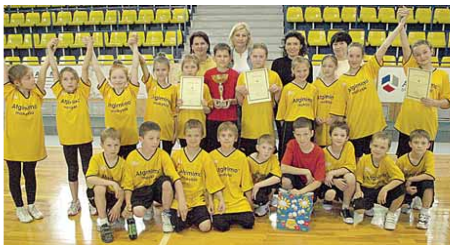
Judriųjų estafečių varžybų „Olimpinės žvaigždutės“ nugalėtojai - „Atgimimo“ vid. mokyklos 1-4 klasių mokiniai

● Gegužės 12 d. Marijampolės stadione įvykusiame 1 valandos bėgime druskininkietis Petras Kavaliauskas, nubėgęs 14 kilometrų, amžiaus grupėje nuo 60 metų tapo geriausiu. Ponas Petras, aktyvus įvairių bėgimų dalyvis, atstovaujantis Druskininkų ėjimo klubui, nuolatos nugalė. „Druskininkų Puma pusmaratonio“ bėgime jis taip pat šventė pergalę.