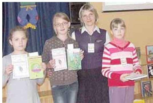
Bibliotekos vedėja su ketvirtokėmis geriausiomis skaitytojomis