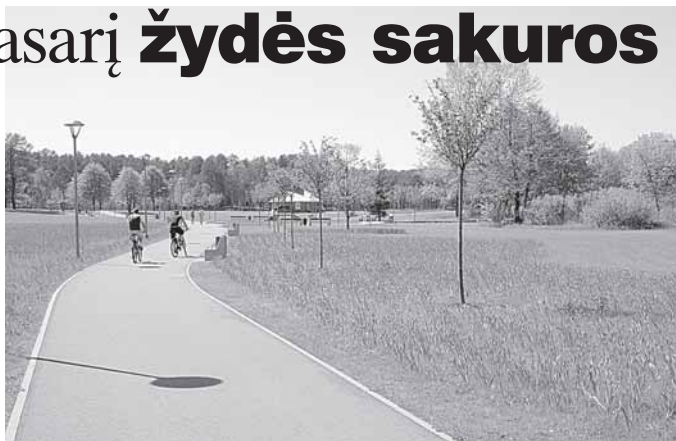
Pėsčiųjų takas tarp Druskonio ežero ir Vijūnėlio tvenkinio bus pavadintas Bronislovo Lubio vardo alėja

Kurorte bus įamžintas pernai mirusio Druskininkų garbės piliečio, vieno garsiausių šalies verslininkų ir turtingiausių Lietuvos žmonių Bronislovo Lubio atminimas.