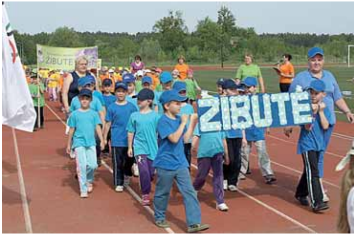
Sportinių estafetėių „Linksmi, sveiki ir žvalūs“, skirtų Olimpinei dienai, paradas