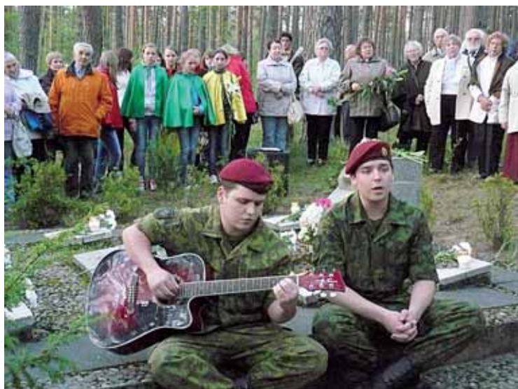
Savanorių duetas Mergelės akių memorialo