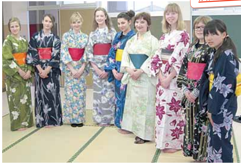
Bandytas pabūti japonėmis vilkint kimono