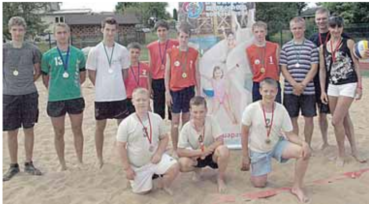
Paplūdimio tinklinio varžybų prizinininkai