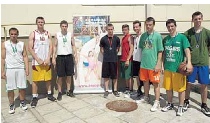
Gatvės krepšinio 3/3 varžybų kurorto šventėje prizinininkai