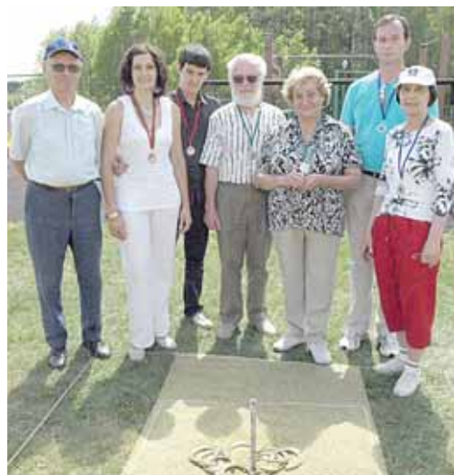
Pasagos mėtymo prizinininkai