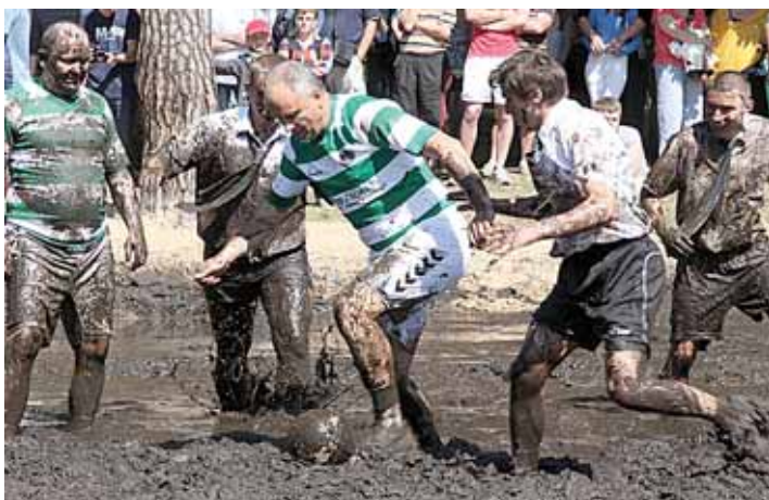
Neįprastų varžybų akimirkos