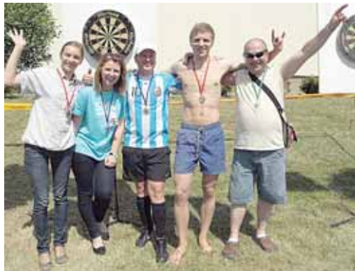
Smiginio varžybų prizininkai