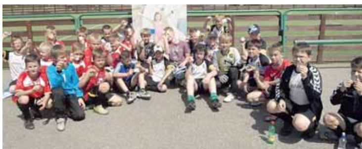
Futbolo 5x5 vaikų grupės varžybų prizinininkai