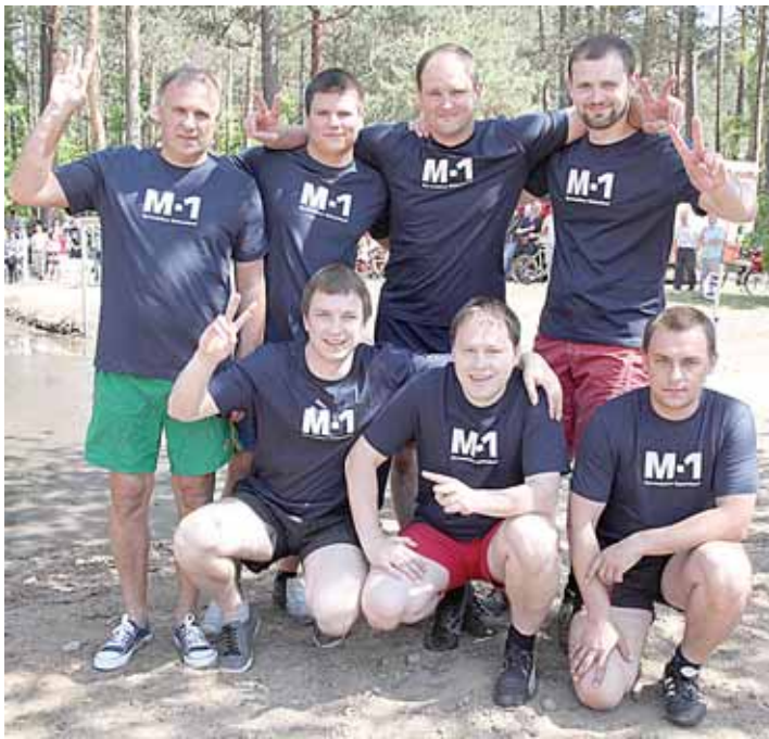
„Grand SPA Lietuva“ komanda