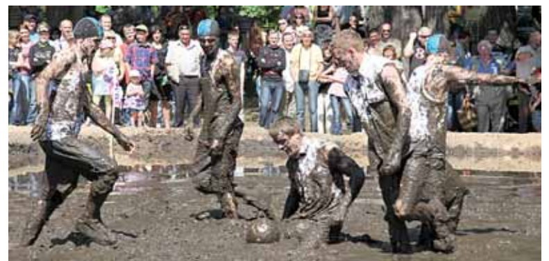
Tiek daug žiūrovų juoko ir gerų emocijų futbolo varžybos dar nematė