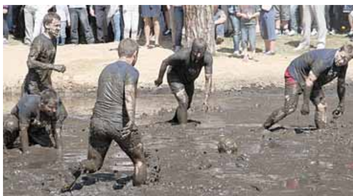
Po sunkaus mačo purve vyrai vos vilko kojas