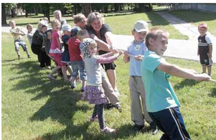
Leipalingio vaikų lopšelio-darželio „Liepaitė“ sporto šventėje