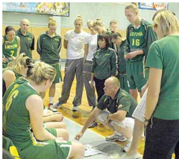
Europos čempionato atrankos kovoms Druskininkuose besirengianti Lietuvos moterų krepšinio rinktinė mūsų sporto centre žaidė su Baltarusijos komanda