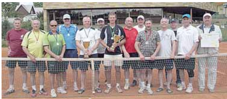
Teniso dvejetų turnyro dalyviai ir prizinininkai

dos prisistatė skauduotėmis. Savo vikrumą, greitą orientaciją ir norą laimėti vaikučiai parodė rungtyse: gėlyčių „skynimas“, šuoliukai ant didelių kamuolių, lindimas pro puslankius, jojimas ant arklukų ir kt. Vyko nuotaišingi tėvelių ir darbuotojų šuoliukai maišuose, mėtymai į krepšį, o bene