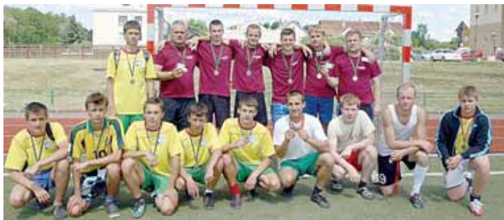
Kurorto šventės futbolo varžybų geriausieji