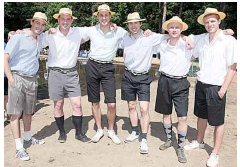
Stilingiausia druskininkiečių komanda - „Tėvonija“