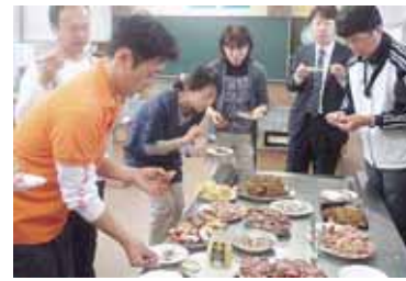
Lietuviškų valgių degustacija