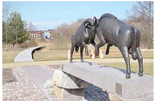
Beskonis kičas – avinų skulptūra