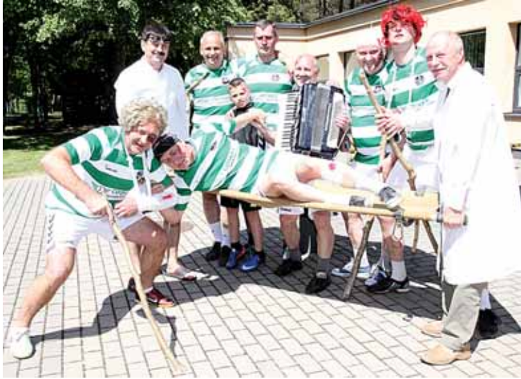
Nugalėtojai - futbolo veteranų klubas „Klipatos“