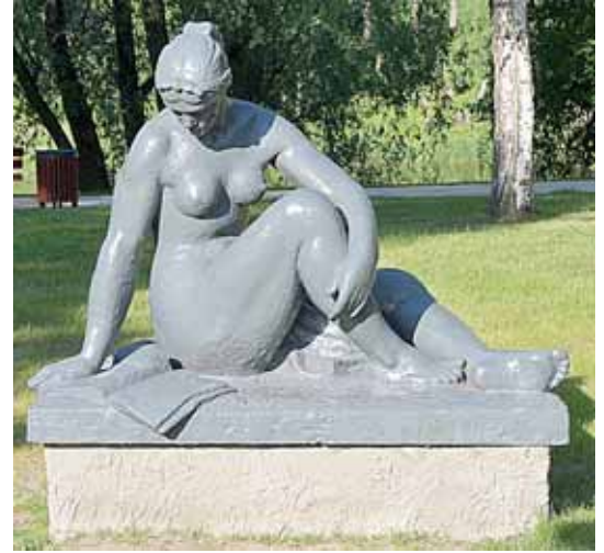
Špižinė skulptūra gydyklų parke, nudažyta pilkai kaip šiukšliadėžė