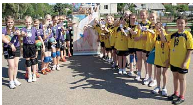
Alytaus ir Druskininkų rankininkės, kurorto šventės metu vykusių varžybų prizinininkės