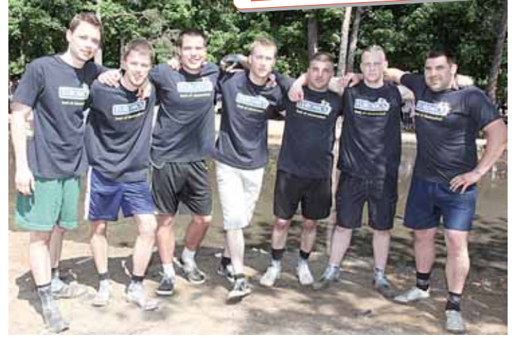
„Euronics“ komanda iš Druskininkų