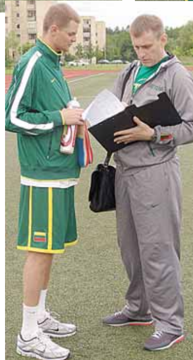
Lietuvos vyrų krepšinio rinktinės kandidatai savo pirmąją treniruočių stovykloje Druskininkuose, „Saulės“ pagrindinės mokyklos stadione