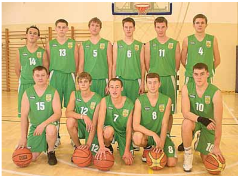
Krepšinio klubo "Leipas" komanda