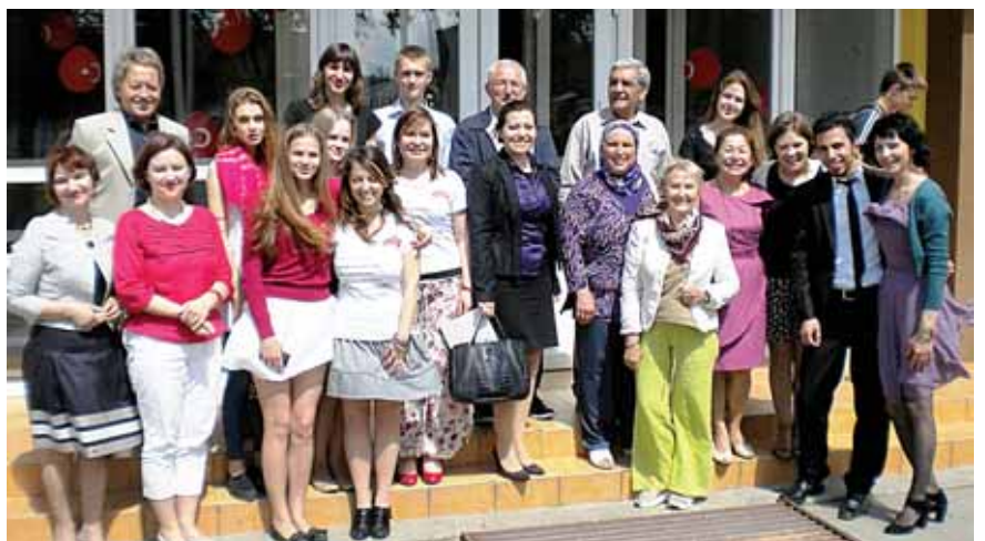
Renginio svečiai ir dalyviai