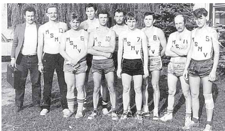
Pergalėmis garsėjusi buvusio Lazdijų MSMV (dabar AB "Leimesta") komanda