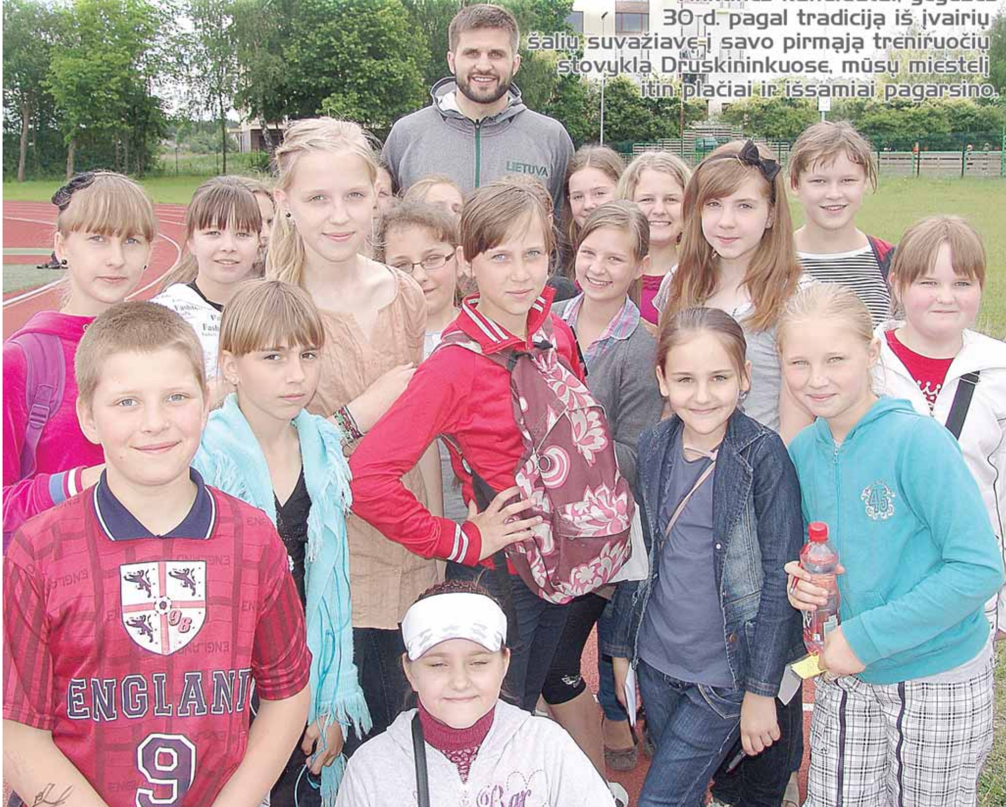
Druskininkų vaikams nusifotografuoti su žymiu Lietuvos rinktinės krepšininku Linu Kleiza - svarbus įvykis

Lietuvos vyrų krepšinio rinktinės kandidatai, gegužės 30 d. pagal tradiciją iš įvairių šalių suvažiavę į savo pirmąją treniruočių stovyklą Druskininkuose, mūsų miestelį itin plačiai ir išsamiai pagarsino.