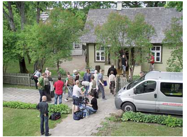
Tarptautinė filmavimo komanda visą gegužės 29-ąją dirbo Druskininkų M.K.Čiurlionio memorialiniame muziejuje