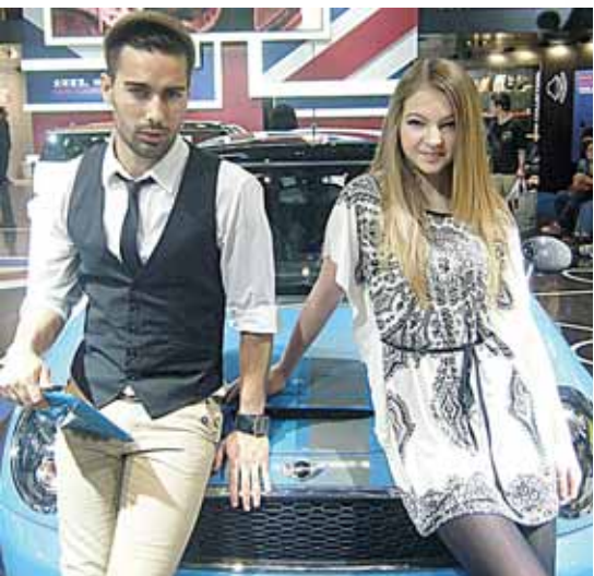
Su draugu iš Austrijos