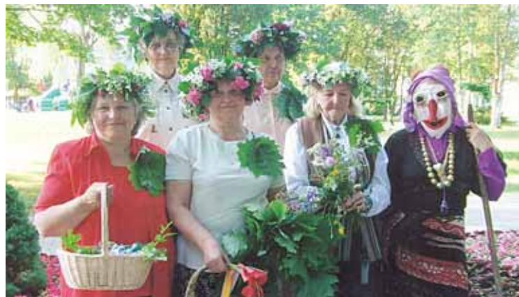
Druskininkų „Bočių“ moterys Joninėse

Joninių proga žaidžiant ir dainuojant pasirodys ir burtininkė, burianti iš vainikų, puokščių, vieno žiedo ir pan. Skelbsim, „kas lauželį kraus, kaitrijų ugnelį sukurs“. Išrinksim gražiausią vainiką, ieškosim Joninių žiedo. Bendru rateliu ir šūksniais skelbsime pasirengimo šventei sėkmę ir lauksim birželio 23-iosios, tikrosios Joninių šventės.