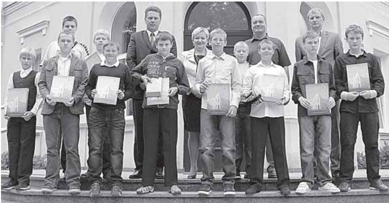
Jaunieji mūsų tinklinio čempionai, geriausi šalyje, buvo pagerbti savivaldybėje