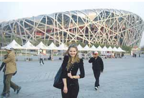
Prie Pekino olimpinio stadiono