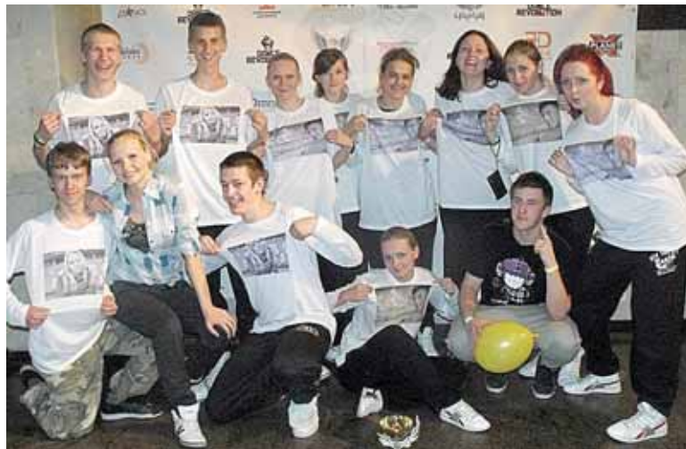
Tarptautiniame šokių konkurse „Dance Revolution 2012“ Vilniuje Druskininkų J&J United komanda užėmė 2-ąją vietą

Gatvės šokių kultūrą Druskininkuose populiariau J&J šokių studijoje šiemet prakaitą liejo daugiau nei 50 įvairaus amžiaus jaunimo. Jie mokosi ne tik šokio technikų, bet ir pagarbos kitiems bei aplinkai, aktyviai dalyvaudami miesto kultūros renginiuose, važinėdami į seminarus bei kviesda-