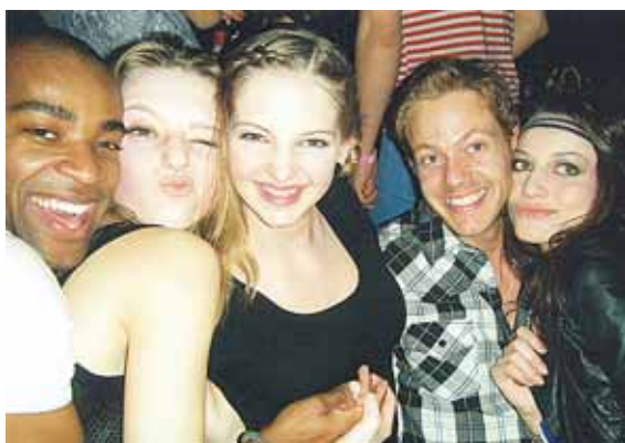
Daugiatautė modelių komanda