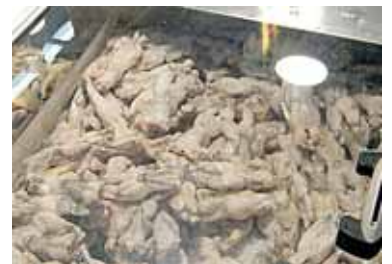
Taip atrodo šaldyta varliena parduotuvėje