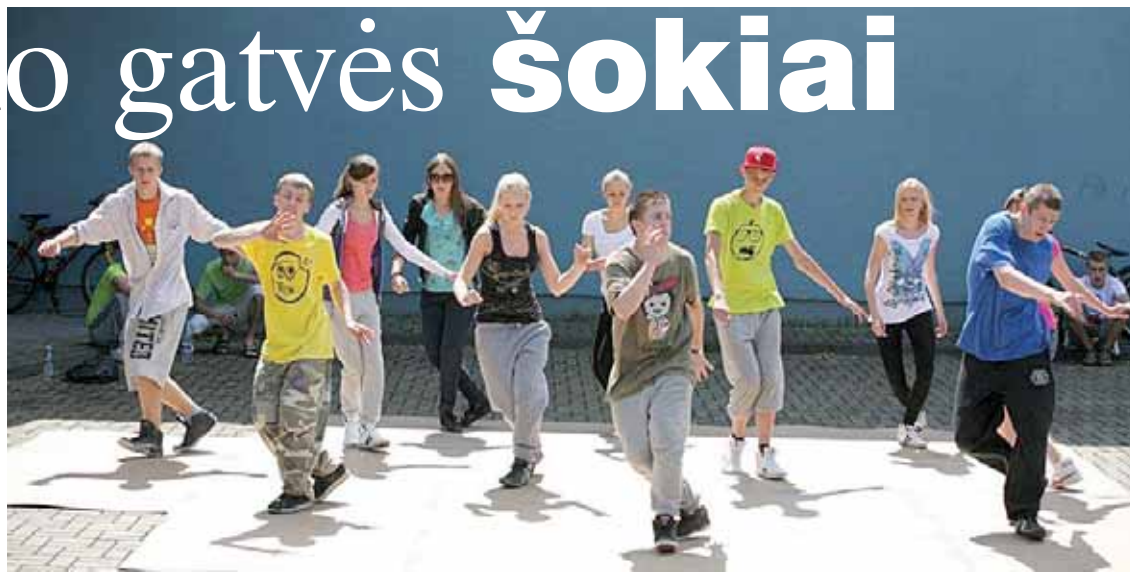
J&J šokėjai kurorto šventėje „Druskininkai - Jėga!“

Druskininkus garsina veržlus, kūrybingas bei pozityvus jaunimas, jau kelerius metus savo energiją ir laisvalaikį skiriantis gatvės šokiams. Birželio 13-ąją sanatorijoje "Belarus" stebėjusieji Druskininkų hip-hopo šokių studijos J&J pasirodymą įsitikino, jog vietinis jaunimas, sukūręs įdomų šou, save atrado būtent tokiu būdu. Tad hip-hopas tampa Druskininkų jaunimo kultūros dalimi.