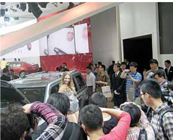
Žurnalistų dėmesys automobilių parodoje