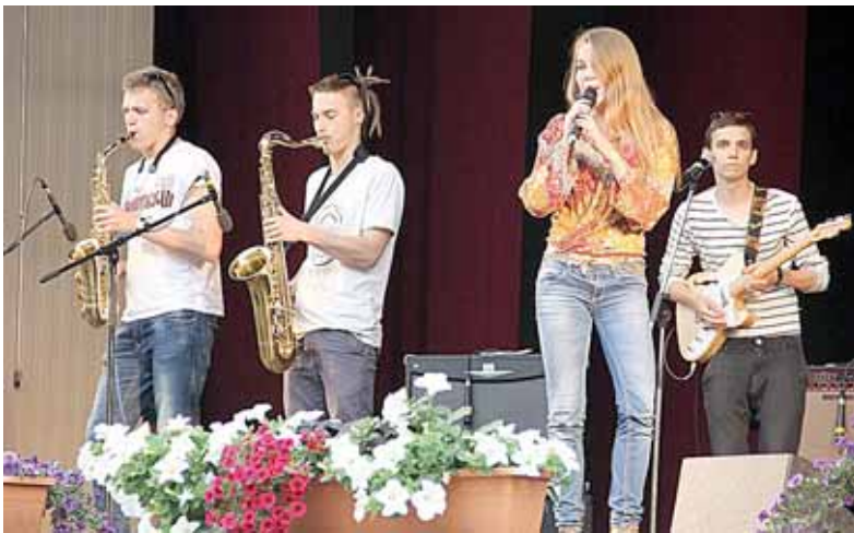
9-ojo tradicinio jaunimo muzikos grupių konkurso „Foozas“ nugalėtoja – grupė „Fun Clock“

Kaip ir kasmet, taip ir šiais metais, Druskininkų jaunimo užimtumo centras birželio 9 d. sukvietė jaunimo muzikos grupes iš visos Lietuvos dalyvauti jau 9-ajame tradiciniame jaunimo muzikos grupių konkurse „Foozas“. Šeštadienio rytą į Druskininkų pramogų aikštę pradėjo važiuoti jaunimo grupės iš skirtingų Lietuvos vietovių, o pavakarę būriavosi muzikos gerbėjai, kurių neišgąsdino net ir prasidėjęs lietus.