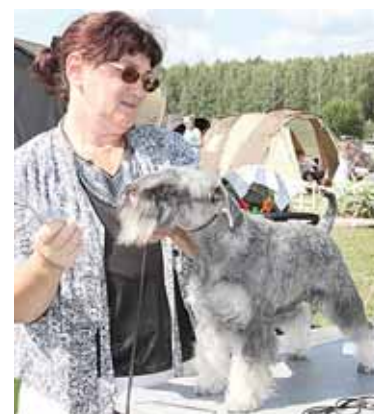
Šis šuo „dirba“ neigalių vaikų klinikoje