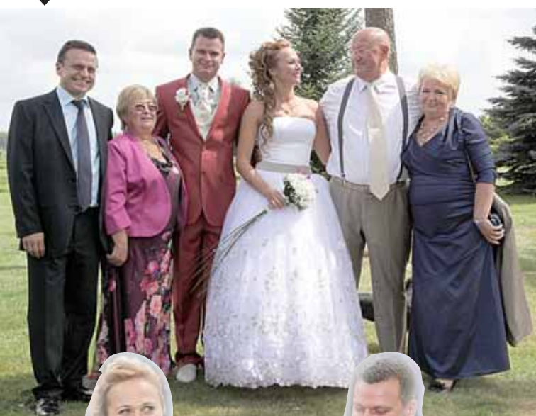
Jaunieji su tėvais