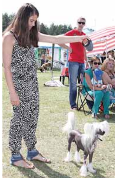
Ne šuniukas, o žaisliukas