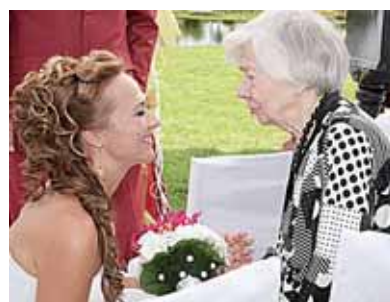
Gyvenimo patarimus anūkei duoda močiutė