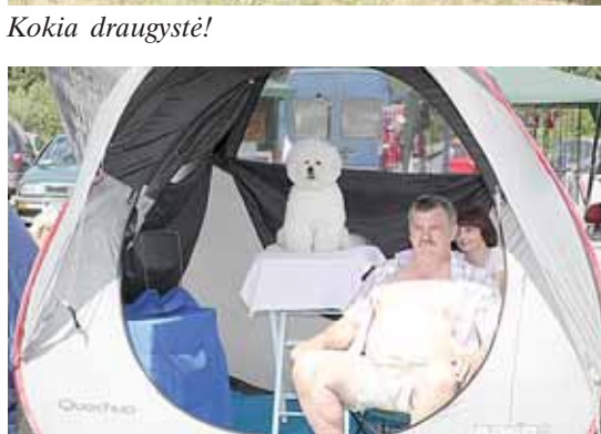
Kuris kieno sargas?