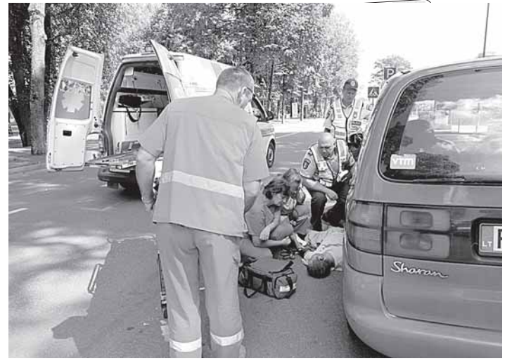
Girtas druskininkietis ant kojų sukėlė specialiąsias tarnybas. Neprikeliamai gatvėje miegojęs vyras atkuto ir puolė auklėti aplinkinius