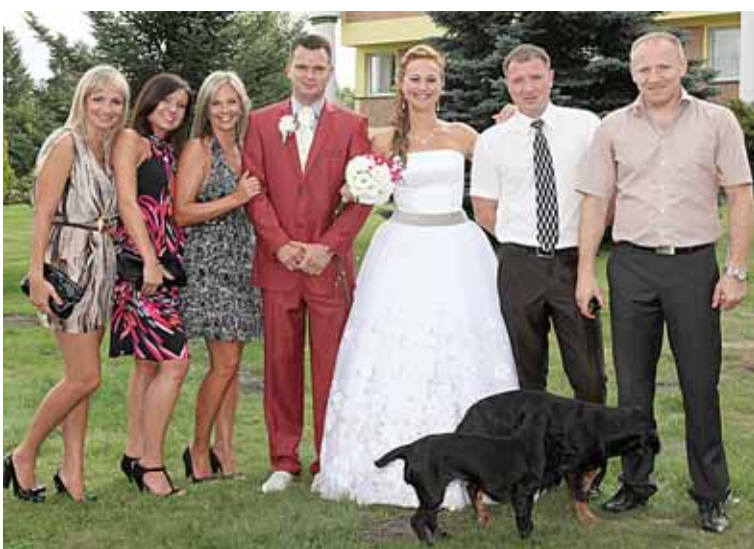
Jaunieji su Birutės giminaičiais