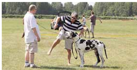
Į parodą atpylė žmonės iš tolimiausių Rusijos kampelių