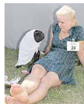
Paslėptas nuo saulės