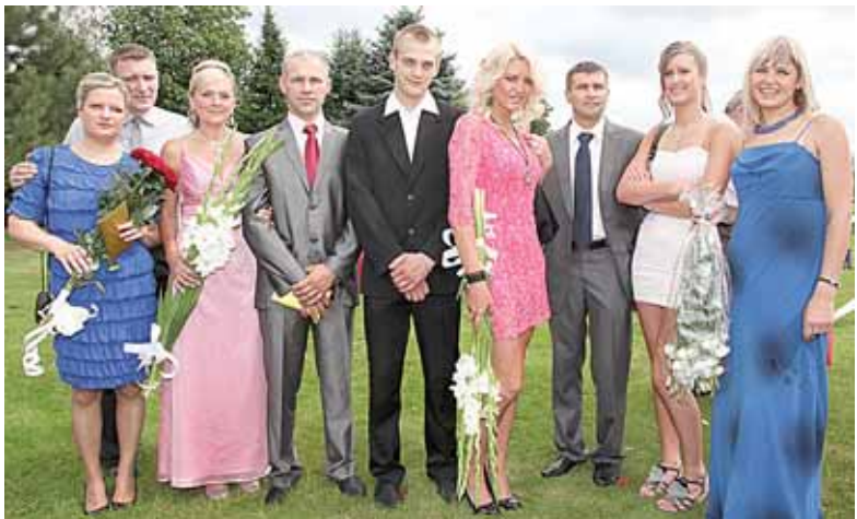
Ričardo giminių giminaičiai