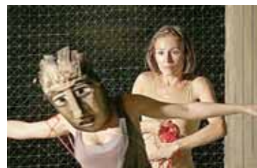
„Didonė ir Enėjas”

Bilietus į festivalį platina „Tiketa”. Juos įsigyti taip pat galite restorane – muzikiniame klube „Druskininkų Kolonada” bei valandą prieš renginius.