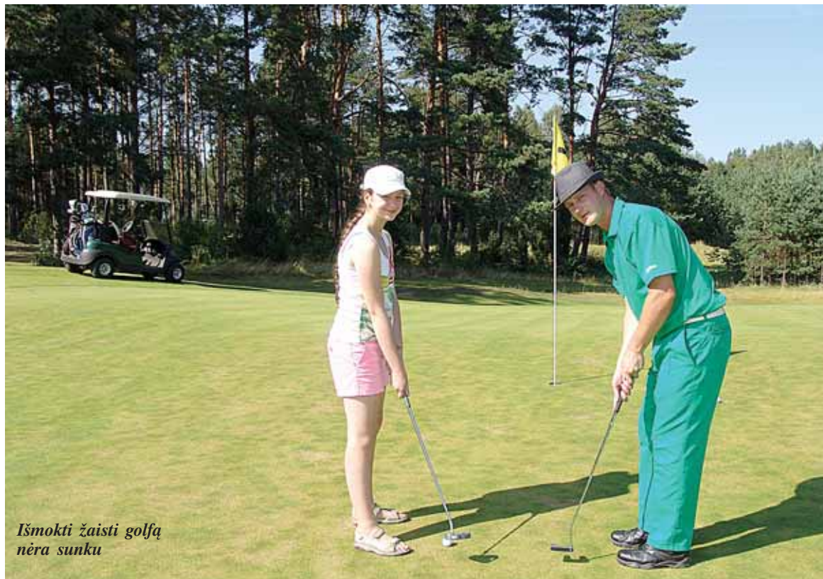
Išmokti žaisti golfa nėra sunku