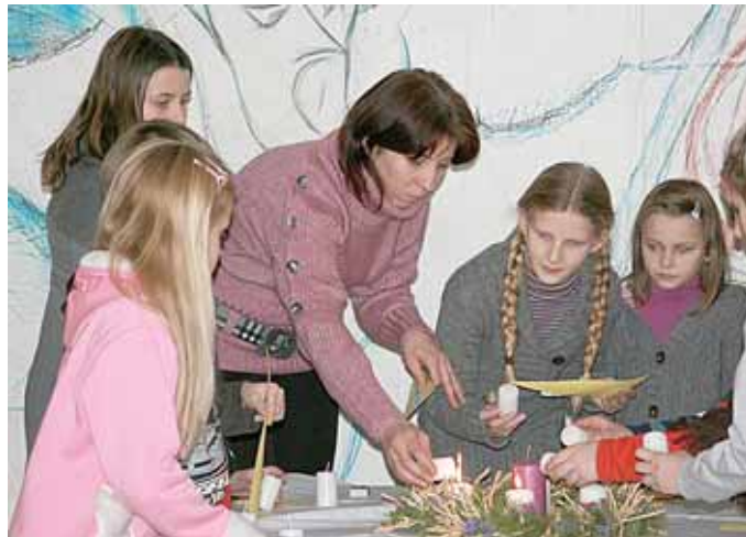
Vieno iš renginių metu