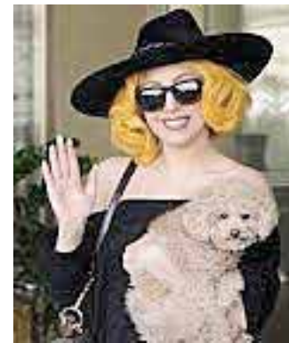
Lady Gaga koncertavo Lietuvoje

Druskininkietė, kaip ir kiti ištikimiausi dainininkės gerbėjai, trokštantis pasirodymą pamatyti iš itin arti, į Vingio parką atvyko dar antradienio ryte, nors koncertas turėjo prasidėti vėlyvą vakarą. Į specialią zoną „Monster Pit“ norintys patekti žiūrovai savo galimybės laukė nuo 8 valandos ryto. Prizas už tokį atsidavimą dainininkei buvo proga koncertu mėgautis iš zonos, įremtos liežuviu formos podiumo. Lady Gagos atstovai kas 15 minučių žingsniavo prie vartų ir įvesdavo žiūrovus į aptvertą Vingio parko erdvę, kurioje vakare vyks įspūdingas koncertas. Toks ritualas atliekamas kiekviename mieste, kuriame vyksta dainininkės pasaulinių gastrolių koncertai. Vietos arčiausiai