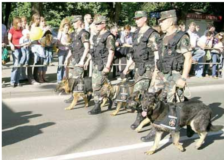
Šventinėje eisenoje Druskininkuose