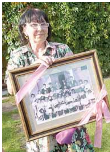
1962-ųjų metų abiturientų laidos išdidintą nuotrauką buvę auklėtiniai padovanojo klasės auklėtojai

Pokalbio intriga užmezgė šiuolaikiška ir aktuali minklė: „Kuo mokytojas panašus į jūrų piratą?“ Iš pradžių sulaukta nustebimo, netgi pasipiktinimo. Visgi mąstymas įsilingavo ir įgavo svarių pastebėjimų. Išrinkau įdomiausią. „Piratas ir mokytojas yra velnias ir karvė: karvė duoda pieną veltui, neiškodama atlygio. Velnias atima ir niekada negražina skolos. Beje, abu raguoti“. Pateikiau girdėtą palyginimą, kurį man mestelėjo VU studentė: „Piratas ir mokytojus jungia kažkada gaubusi romantikos skraistė. Taip pat ir šių profesijų nuvertinimas – mokytojai dabar tik paslaugų teikėjai, o piratai – tik plėšikai“. Suradome ir humaniškesnį apibūdinimą. Piratas yra tas žmo-