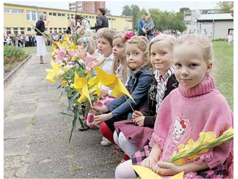
Šįmetinė rugsėjo 1-oji „Atgimimo“ vid. mokykloje