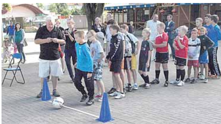
Futbolo šventėje Druskininkų jaunimas