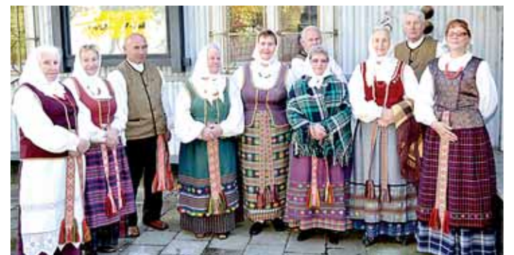
Plenero „M.K.Čiurlionio dienos 2012“ dalyviai pažinti su Dzūkija pradėjo nuo etnografinio ansamblio „Stadalėlė“