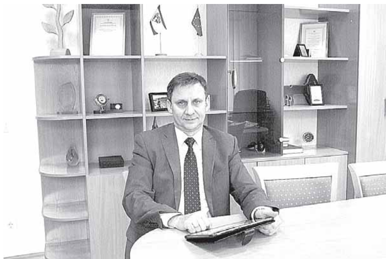
VSD FV Alytaus skyriaus direktorius V.Vencius: „Labai svarbu žinoti, kad PSD įmokas reikia sumokėti ne vėliau kaip iki einamojo mėnesio paskutinės dienos, nes pavėlavus jas sumokėti, asmuo nėra draudžiamas privalomuoju sveikatos draudimu“

Daug savarankiškai dirbančių asmenų PSD įmokas nuo pajamų, gautų praėjusiais metais, mokėjo