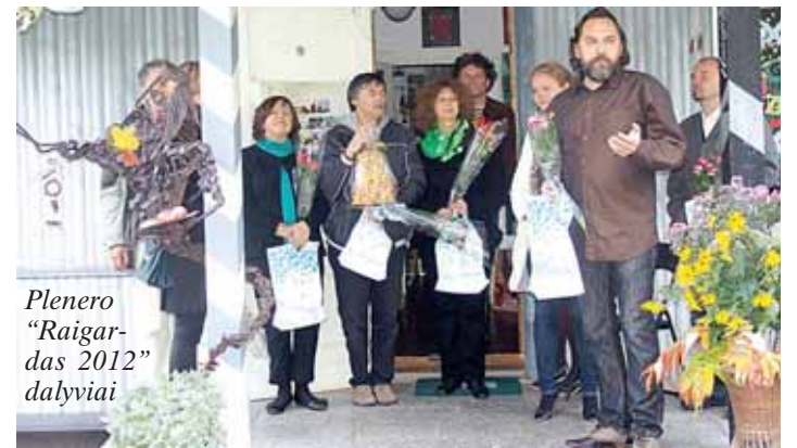
Plenero „Raigardas 2012“ dalyviai