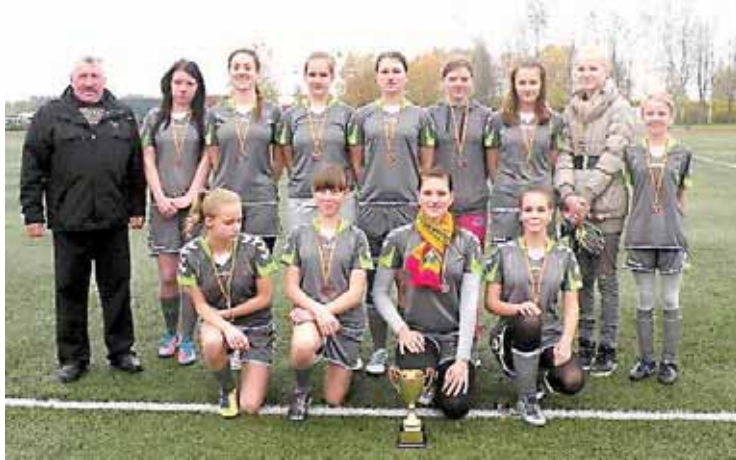
Druskininkų „Arnikos“ merginos (treneris V. Kapčius) Alytaus apskrities atviraime moterų futbolo čempionate pelnė 3-ąją vietą

Atviraime čempionate, kuris vyko dviem etapais, pavasarį ir rudenį, dalyvavo 5 komandos. 1-ame etape druskininkietės, pralaimėjusios 2:3 Alytaus „Dainavai“ ir 1:4 Vilniaus „Žalgirietėms“ bei 4:0 įveikusios Marijampolės „Sūduvos“ ir lygiosiomis sužaidę su Alytaus SRC „Titanas“ komanda, pateko į finalinių varžybų etapą. Pusfinalio varžybas pralaimė-