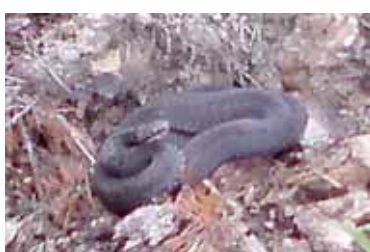
Uogavimas drauge su angimis