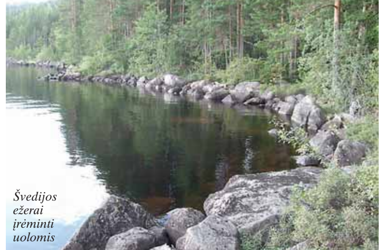
Švedijos ežerai įrėminti uolomis