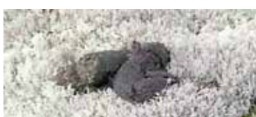
Čia ką tik pabuvojo meškutė