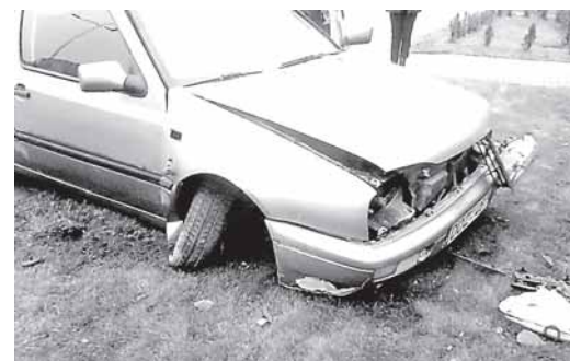
Mašina buvo gerokai suniokota