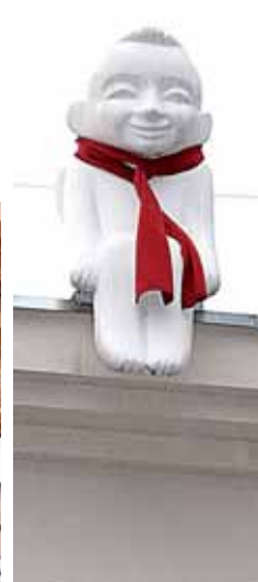
Angeliukas ant stogo jau papuoštas Kalėdoms