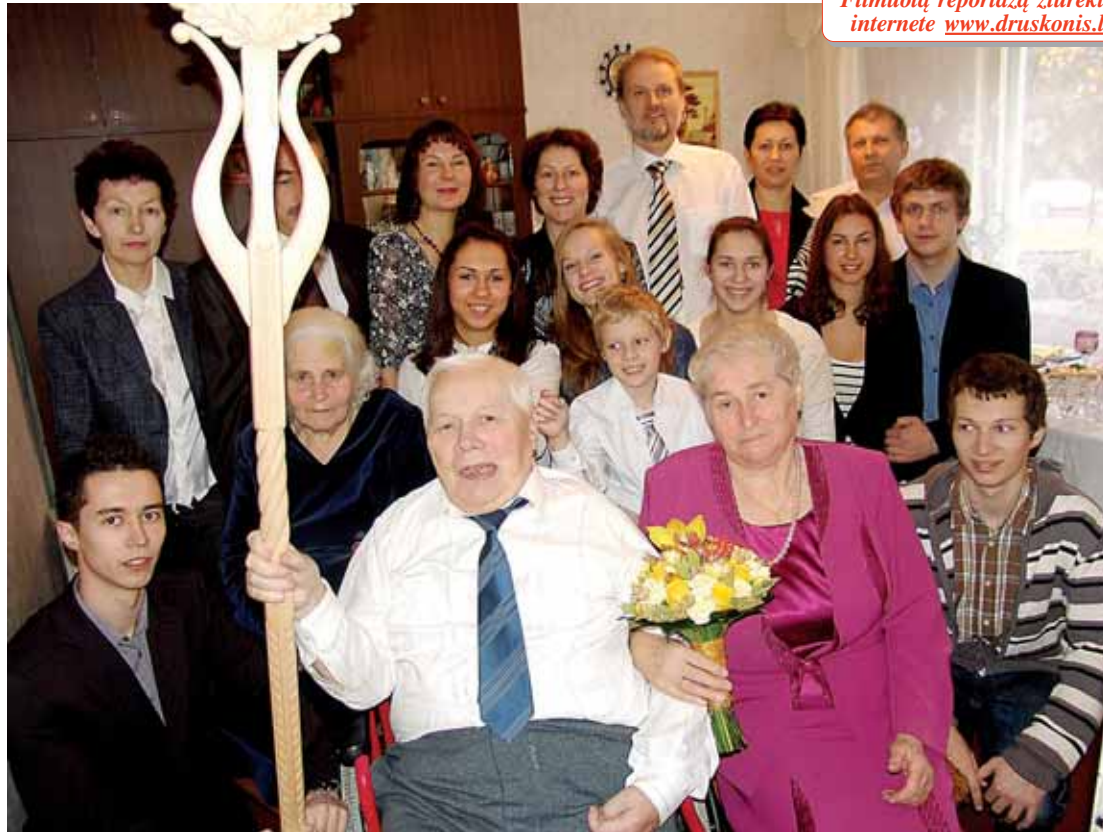
Jubiliatai kartu su pačiais artimiausiais žmonėmis