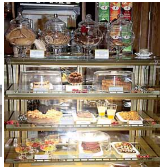
Pasaulio šalis galima atrasti ir ragaujant desertus

tas esu aš? Vilniaus universitete esu baigęs prancūzų filologiją. Prancūzų kultūra ir jų gyvenimo būdas man artima širdžiai.