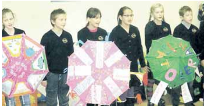
Ketvirtokai „Tolerancijos skėčių“ parodos atidaryme

tautinės nerūkymo dienos renginys buvo susitikimas su Lazdijų visuomenės sveikatos centro darbuotoja. Buvo rodomos skaidrės ir filmukai apie brangaus „malonumo“, rūkymo, žalą sveikatai ir grožiui. Lėlė – rūkalė pademonstravo, kaip veikia organizmą viena surūkyta cigaretė. Paskaitos klausytojai buvo suskirstyti į komandas, kurios turėjo sukrauti, kiek žmogus išleidžia pinigų rūkalams per savaitę, mėnesį, metus, jei per dieną surūko vieną pakelį cigarečių, kuris kainuoja 6 Lt. Mokiniai pasiūlyta pagalvoti, ką už šiuos pinigus būtų galima nusipirkti. Atsakymai