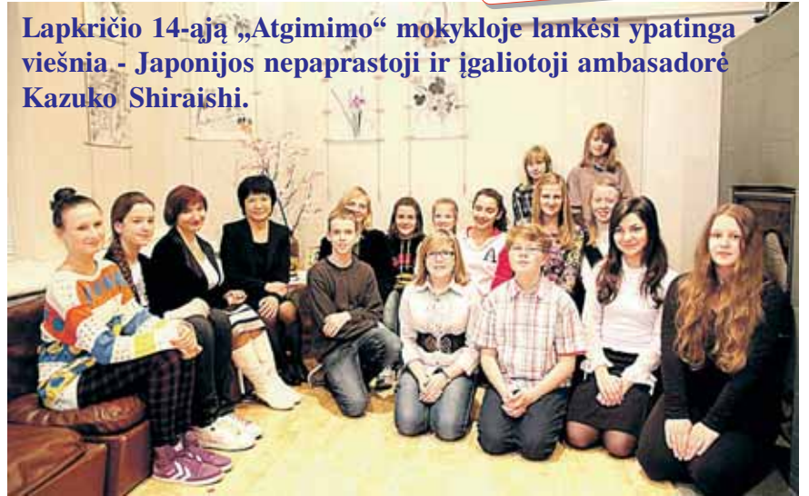
Japonijos ambasadorė susitiko su „Atgimimo“ mokyklos bendruomene

Lapkričio 14-ąją „Atgimimo“ mokykloje lankėsi ypatinga viešnia - Japonijos nepaprastoji ir įgaliotoji ambasadorė Kazuko Shiraishi.