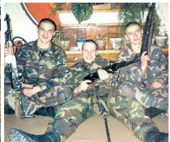
Privalomoje tarnyboje su kuopos draugais

Lietuvos etmono Jonušo Radvilos mokomąjį pulką. Mes ten buvom pirmieji šauktiniai, nes šis karinis vienetas buvo ką tik suformuotas, buvome pirmoji šio mokomojo junginio karių laida.