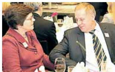
Teisėjas Algirdas Auruškevičius su žmona