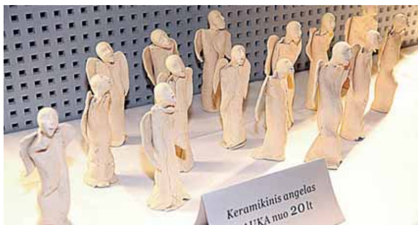
M.K.Čiurlionio meno mokyklos angeliukai