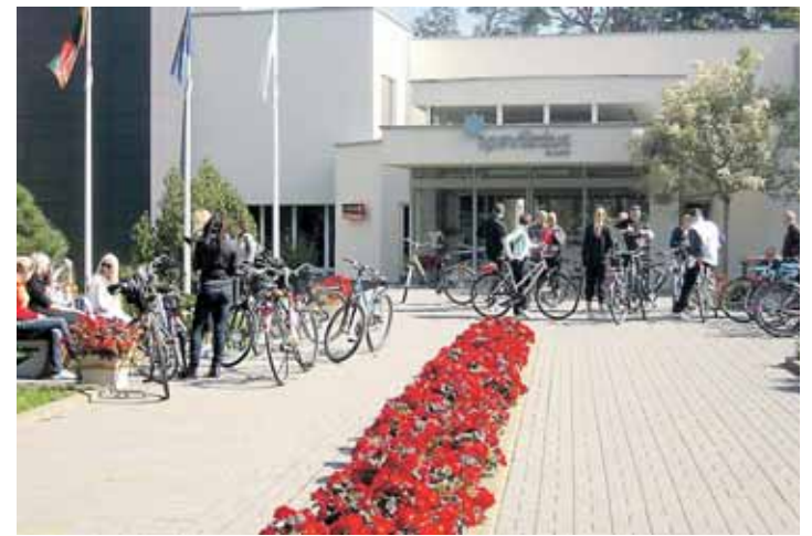
Darbuotojams rengiamos įvairios išvykos dviračiais, baidarėmis, apžiūros lankytinos vietos

cipuose taip pat akcentuojamas siekis panaikinti bet kokią privalomąją ar priverstinę darbą, vaikų darbą ir bet kokią diskriminaciją, susijusią su įdarbinimu ir profesija. Verslo organizacijos, priklausančios susitarimui, remia prevencines programas, užtikrinančias aplinkos apsaugą, imasi iniciatyvų aplinkosauginę atsakomybę didinti ir skatina aplinkai palankių technologijų vystymąsi ir plitimą.