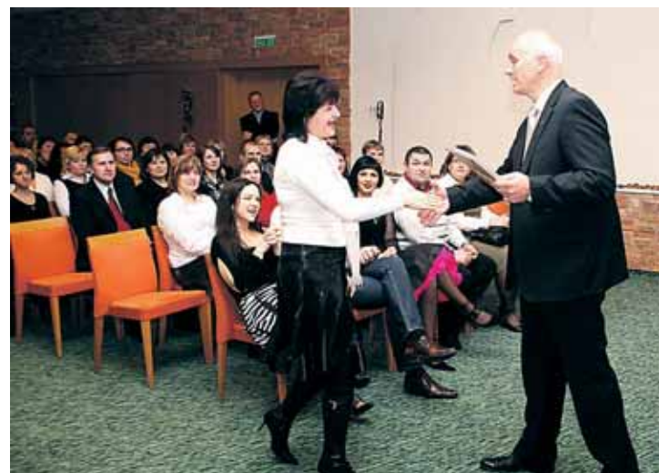
SPA Vilnius SANA suteikia galimybes tobulėti, skatina ir apdovanoja savo darbuotojus