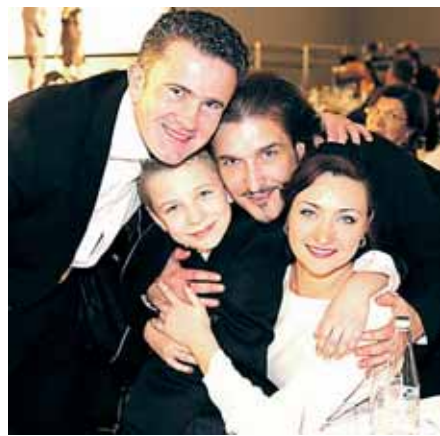
Žavi Gaičiūnų dinastija