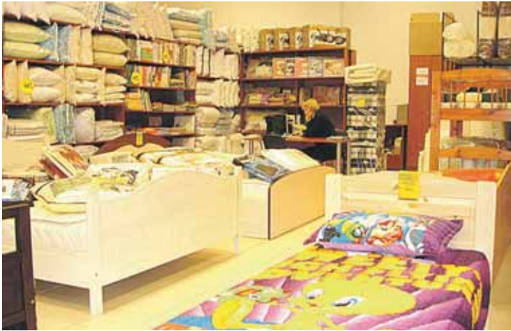
„Miego imperijos“ parduotuvė M.K.Čiurlionio g. 50, prekybos centro „Aidas“ 3-ame aukšte

Patogioje privažiavimui bei apsipirkimui vietoje, Druskininkų centre, M.K.Čiurlionio g. 50, prekybos centro „Aidas“ 3-ame aukšte, virš mini „Maxima“, jau šį kalėdinį gruodžio mėnesį pradėjo veikti 70 kv. m (sausio mėnesį parduotuvės plotas padidės iki 220 kv. m) druskininkiečių jau pamėgta ir palankiai įvertinta nauja patalynės, patalų, čiužinių ir baldų parduotuvė „MIEGO IMPERIJA“, pasiūliusi plačiausią prekių asortimentą už patrauklią kainą. Tai jau 4-oji parduotuvė su „MIEGO IMPERIJA“ ženklu Lietuvoje.