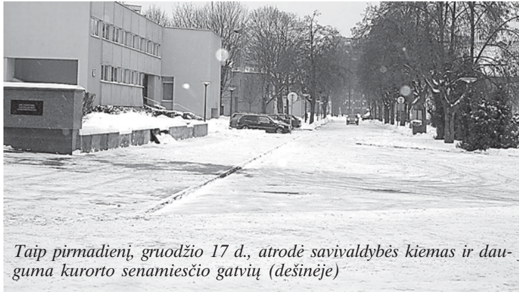
Taip pirmadienį, gruodžio 17 d., atrodo savivaldybės kiemas ir dauguma kurorto senamiesčio gatvių (dešinėje)

Savaitgalį kurortą užgriuvusi sniego lavina išlėkė gatvių bei šaligatvių prižiūrėtojams. Trečiadienį komunalinių tarnybų at-