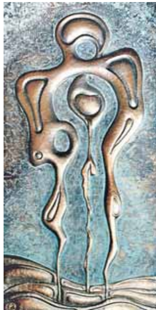
Metalo plastikos darbas „Pakilęs širdimi“. Homo sapiens žmogišką pavidalą įgauna tada, kada gyventi pakyla širdimi, o ne naudosis iššokimui, ambicijomis, kerštu

Kituose miestuose taip pat sėkmingai įsisavinami Europos Sąjungos pinigai, gerinant jų infrastruktūrą, juos civilizuotai ir skoningai puošiant, gražinant, tačiau niekur nesu matęs ar girdėjęs, kad miestų valdžia už mokesčių mokėtojų pinigus taip nekukliai (sakyčiau begėdiškai) save iškelty virš miesto piliečių. Prisimenu da-