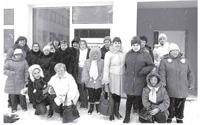
„Druskininkų vilties“ bendrijos atstovai Alytuje

Artėjant metų šventėms, veiklios bendrijos „Druskininkų vilties“ nariams labai norėjosi aplankyti senus draugus, užsukti pas tuos, kuriems trūksta namų šilumos, artimųjų meilės.