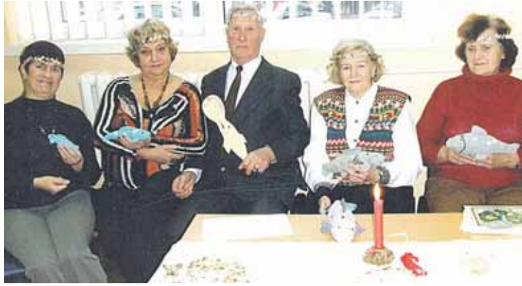
Aktyvus “Bočių” klubas “Kraitė” neseniai organizavo kitą renginį, skirtą rankų darbo žuvims