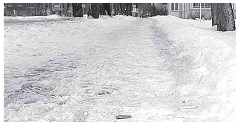
Sausio 30-osios rytas. Kurorto gatvės prižiūrincios mašinos pravažiavo, išnaudodamos brangų kurą, bet rezultatas - akivaizdus...