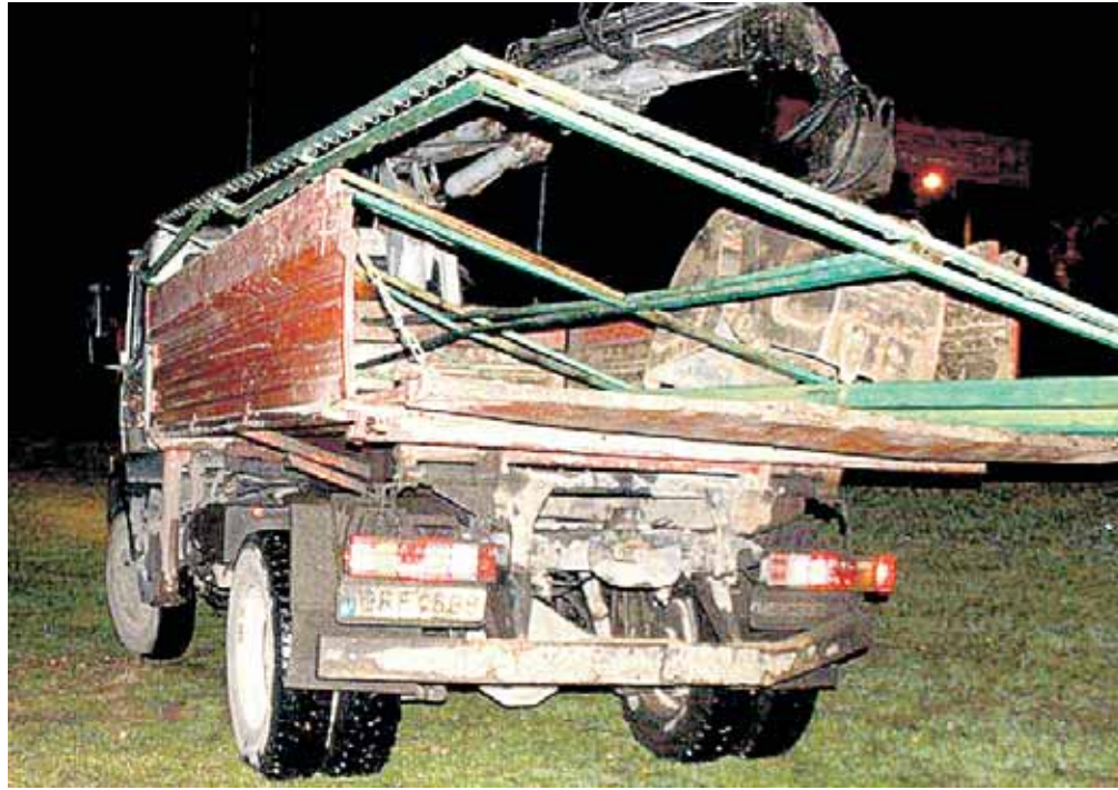
Taip Druskininkuose susidorojama su politiniais oponentais

207 2 str. 5 d., kuris numato administracinę atsakomybę už trukdymą kandidatui į Seimo narius susitikti su rinkėjais ar kitokiu būdu vykdyti rinkimų agitaciją, L.Urmanavičiui Druskininkų teismas skyrė 350 litų baudą.