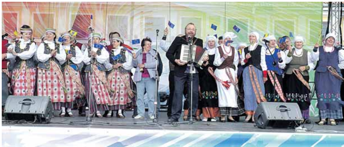
Didelis būrys meno kolektyvų surengė išpūdingą koncertą Gardine