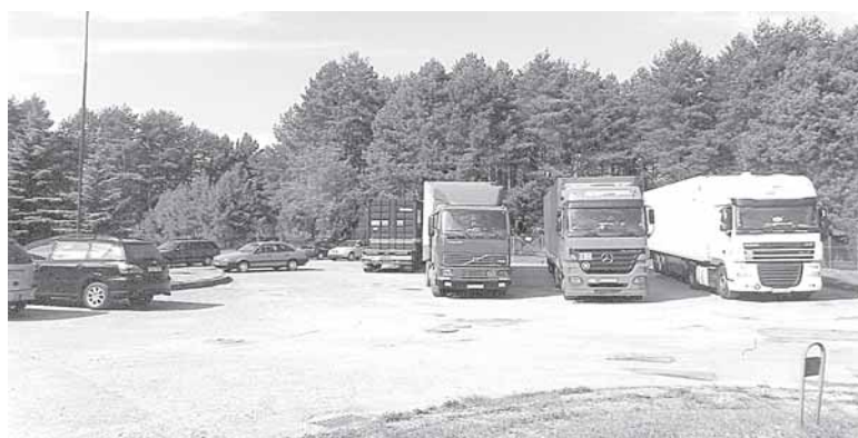
Prie gyvenamųjų namų Gardino g. 41 ir 43 a visais metų laikais vaizdas panašus

Gyventojai ne vieną kartą kreipėsi į muitinės sandėlių savininką