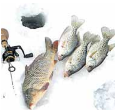
Viskonsino upės deltoje veisiasi kitokios žuvis nei pas mus