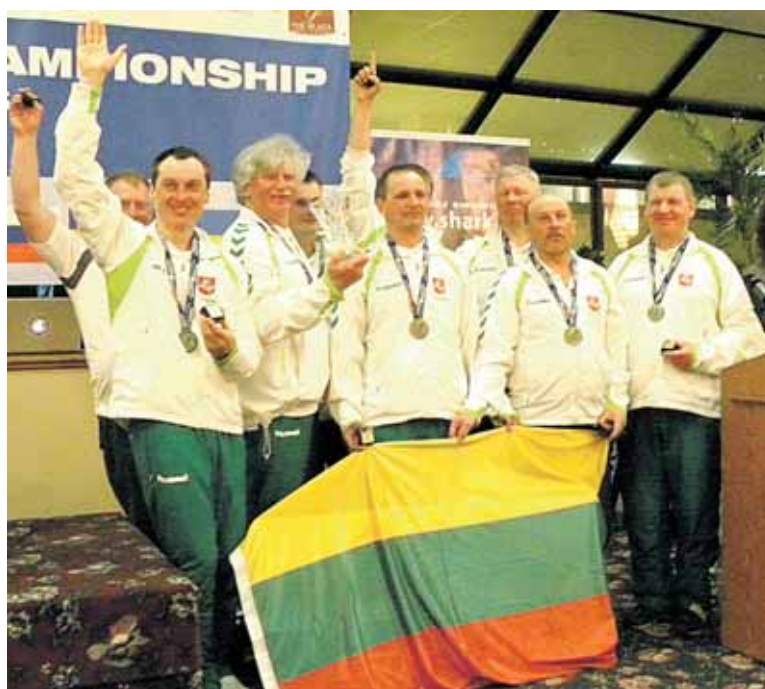
Mūsų žvejai po apdovanojimo bronzos medaliais