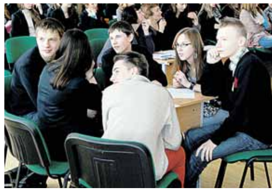
1a klasės komanda