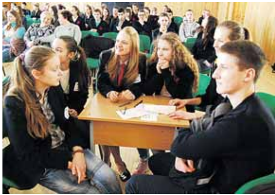
Viktorinos nugalėtoja - 1d klasė