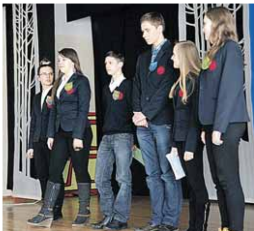
1c klasės matematikai