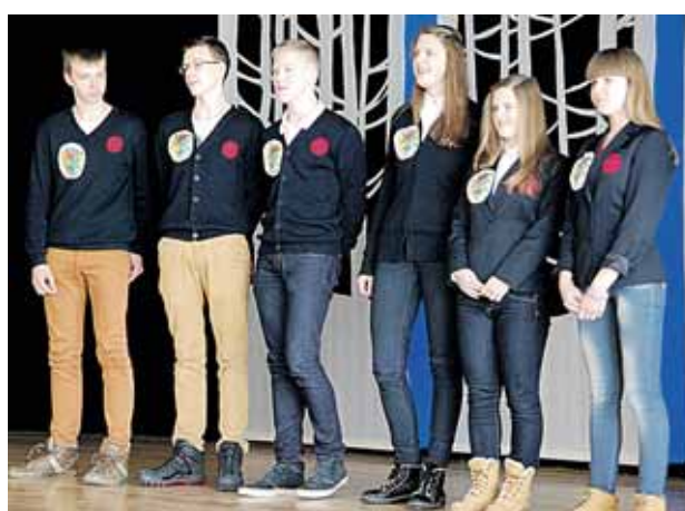
1b klasės atstovai