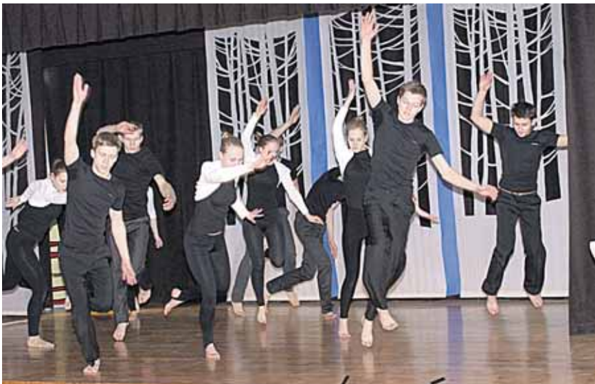
Druskininkų istorijos įvairius laikotarpius "Ryto" gimnazistai perteikia įtaigiu šokiu, raiškiai žodžiu, melodingomis dainomis