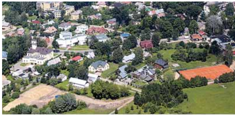
2004-07-02 statybos pradžia. Tvoros nėra