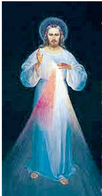
Gailestingą Jėzų paveikslą natūralaus dydžio fotokopija nuo šiųmetinių Velykų kabo Druskininkų bažnyčioje

Taip pat pažadu jai pergale prieš jos priešus jau čia, žemėje, o ypač mirties valandą. Aš apginsiu ją, kaip savo paties garbę”.