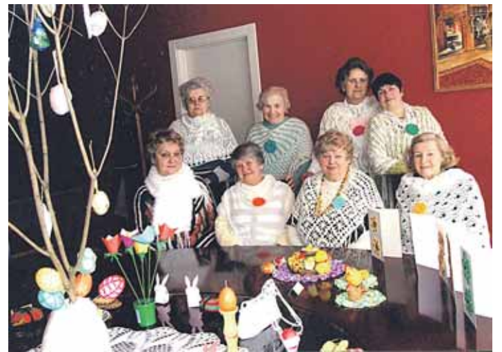
“Bočių Kraitės” moterys, kurios balandžio 21 d. surengs Jurginių apeigų šventę

Mūsų tradicine kultūra daugiausia domisi jauni žmonės, pabuvoję užsieniuose, nes svetur teiraujamosi apie mūsų tautybę (kalendorines šventes, papročius, simbolius ir kt.). Todėl mums ir mūsų vaikams labai svarbu domėtis tautinėmis tradicijomis.