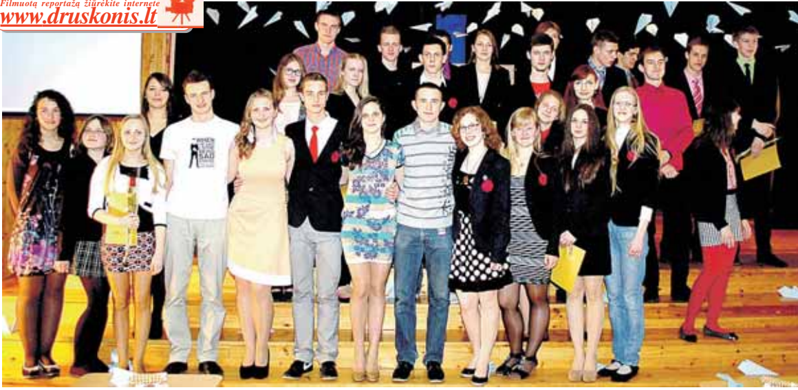
„Bravo gimnazistas 2013“ nominantai

Filmuotą reportažą žiūrėkite internete www.druskonis.lt