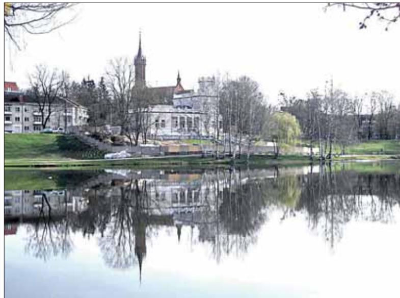
Gegužės rytas prie Druskonio

terneto puslapiu “Druskininkų Fotoknyga” ( http://druskininkufoto.knyga.getbb.org/ ) geriausius savaitės kadrus, kuriuose druskininkiečiai bei miesto svečiai užfiksuoja Druskininkų ir apylinkių gamtos, kraštovaizdžio, aplinkos vaizdus. Pradedame: