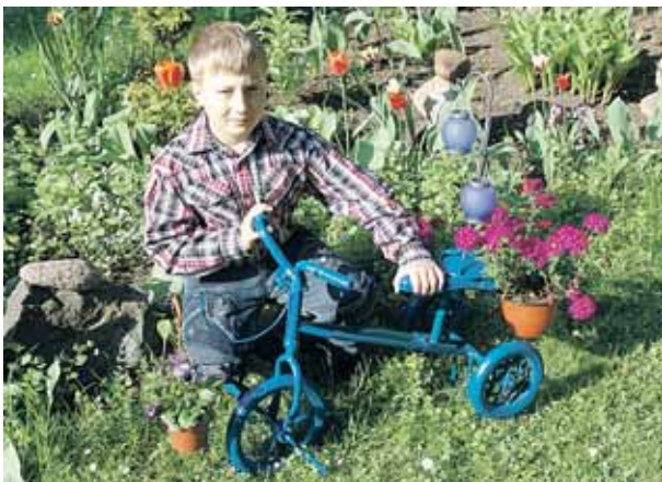
Raigardas prie senovinio dviratuko

jos dukra. Tokia idėja joms labai patiko, nes Druskininkai yra puiki vieta dviratinkams. Tad originalus gėlynas – artimų giminaičių trijulės sugalvotas ir nuosavais pinigėliais išpuoselėtas grožis.